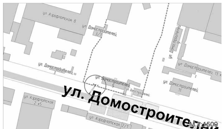
Схема границ прилегающей территории к зданию общества с ограниченной ответственностью «Сибнефтьтранссервис» (медицинский кабинет), расположенному по адресу: город Сургут, улица Домостроителей, дом 5, на которой не допускается розничная продажа алкогольной продукции

Условные обозначения: ▼ – вход для посетителей на территорию ООО «Сибнефтьтранссервис»; R – радиус в метрах; ----- – металлический забор, граница обособленной территории.