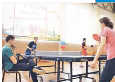
Без отрыва от учебы