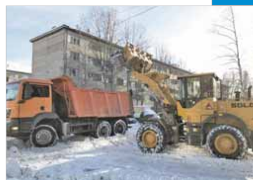
Интернет в помощь