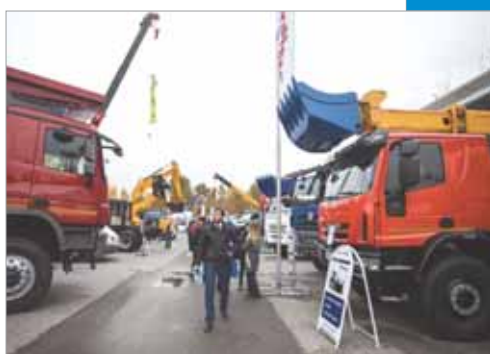
Сургутская ярмарка XXI века