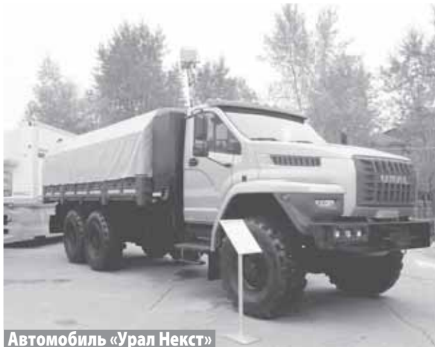
Автомобиль «Урал Некст»

■ Есть ли планы по развитию завода, расширению ассортимента?