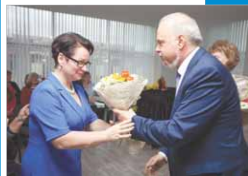
С благодарностью к педагогам