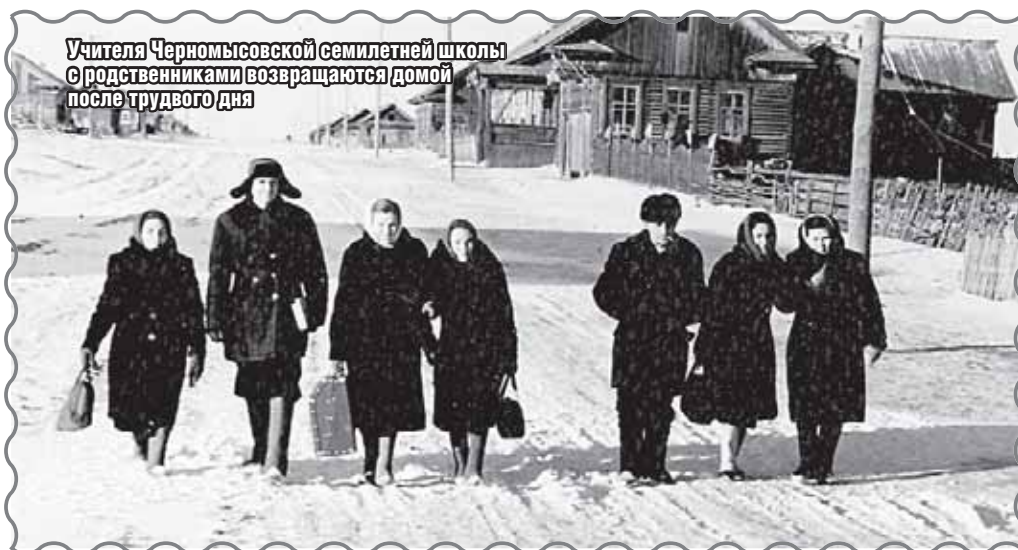
Учителя Черномысовской семилетней школы с родственниками возвращаются домой после трудового дня

Флегонт ПОКАЗАНЬЕВ