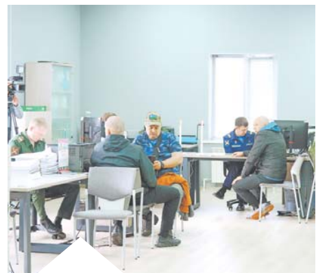
Для заключения контракта с Минобороны РФ Алексей выбрал Югру

Напомним, правительство Югры увеличило на 900 000 рублей размер единовременной выплаты при заключении контракта на военную службу в