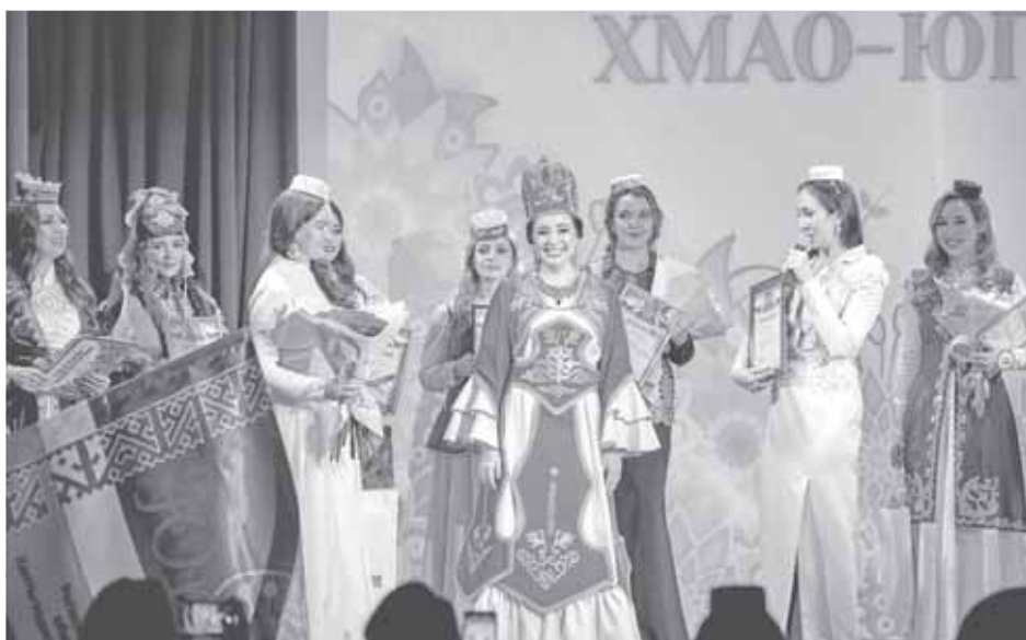
В финал конкурса «Татар кызы ХМАО-Югры 2023» вышли 11 девушек