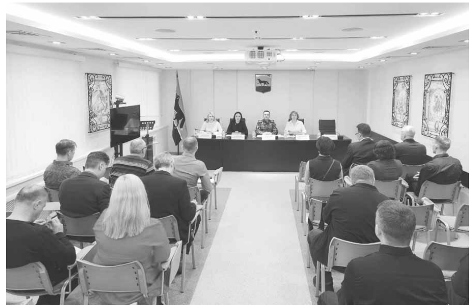
Управление по вопросам общественной безопасности Администрации города

Управлением по вопросам общественной безопасности проведен семинар для работников объектов жизнеобеспечения. Темами семинара стали антитеррористическая защищенность объектов города и противодействие идеологии терроризма и экстремизма. Работникам рассказали, как противостоять современным угрозам в сфере безопасности. Семинар прошел в активном диалоге, участники обменялись практиками, наметили новые цели и задачи.