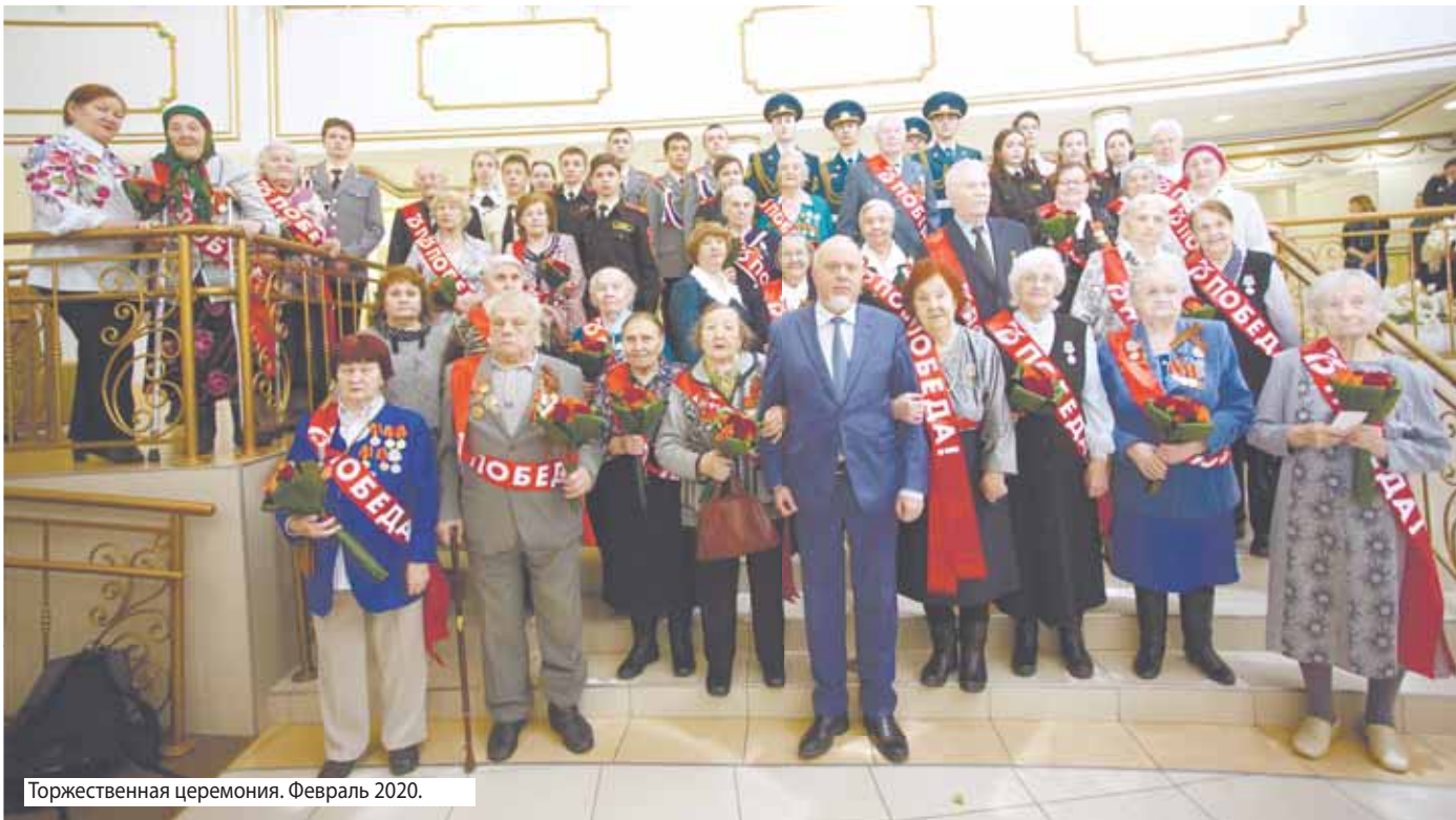
Торжественная церемония. Февраль 2020.

★ В канун празднования 75-летия Великой Победы губернатор Ягры, глава города Сургута, его заместители, руководители структурных подразделений администрации и представители сургутского военного комиссариата вручили ветеранам юбилейные медали «75 лет Победы в Великой Отечественной войне 1941-1945 гг.».