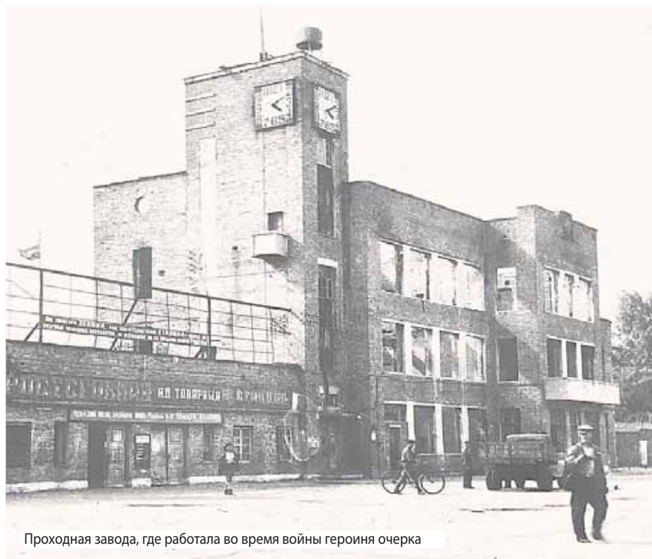
Проходная завода, где работала во время войны героиня очерка

бушующая метель. И Тоська, которая до жути боялась покойников, искала вместе со всеми. Потом она привыкла и к этому, когда после очередной бомбежки шла снова и снова искать тела погибших односельчан. «Потерпи, дочка, – всплывали в голове мамыны слова, – так надо».