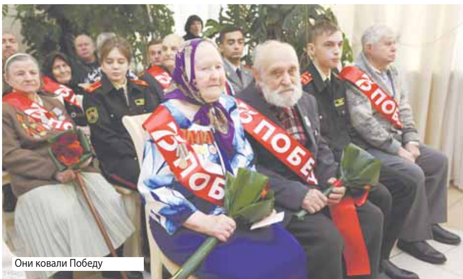
Они ковали Победу