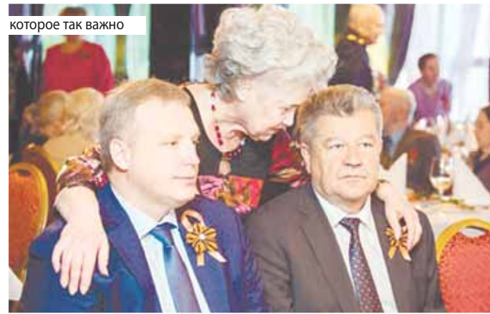
которое так важно

– Планировали, как и в прошлые годы, собрать ветеранов, поздравить и вручить им подарки, но в связи с тем, что сейчас непростая ситуация, придется немного повременить. Но обязательно поздравим. Так как год юбилейный, хотелось сделать это более запоминающимся для ветеранов.