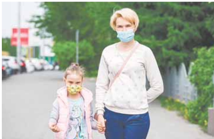
На прогулку по правилам

Было рекомендательным, стало обязательным