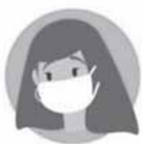
Пользуйтесь защитной маской