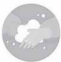
Мойте руки после посещения общественных мест и перед приемом пищи