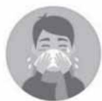
Избегайте контактов с заболевшими