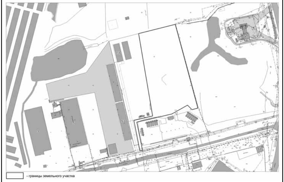
Схема расположения земельного участка с кадастровым номером 86:10:0101064:12, расположенного по адресу: Ханты-Мансийский округ - Югра, город Сургут, восточный промрайон, улица Инженерная, (проезд 2ПР), вид разрешенного использования - объекты дорожного сервиса. Код 4.9.1. Масштаб 1:2000