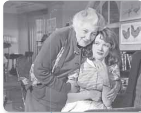
«Осторожно, бабушка», 1960 г.

Кто выручит из неприятной ситуации лучше, чем мудрая и энергичная бабушка? Никто, даже родители. У молоденькой героини картины Леночки, которая в качестве директора Дома культуры, все валится из рук: неопытность мешает ей принимать безошибочные решения. К счастью, у Лены есть опытная бабушка-наставник, которая в помощь ей собирает свою старую гвардию. В потрясающем советском фильме снялись блистательные актеры: Фаина Раневская, Леонид Быков, Ариадна Шенгелая, Сергей Филиппов.