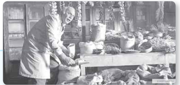
«Щепотка перца», 2003 г.

Кто выручит из неприятной ситуации лучше, чем мудрая и энергичная бабушка? Никто, даже родители. У молоденькой героини картины Леночки, которая в качестве директора Дома культуры, все валится из рук: неопытность мешает ей принимать безошибочные решения. К счастью, у Лены есть опытная бабушка-наставник, которая в помощь ей собирает свою старую гвардию. В потрясающем советском фильме снялись блистательные актеры: Фаина Раневская, Леонид Быков, Ариадна Шенгелая, Сергей Филиппов.