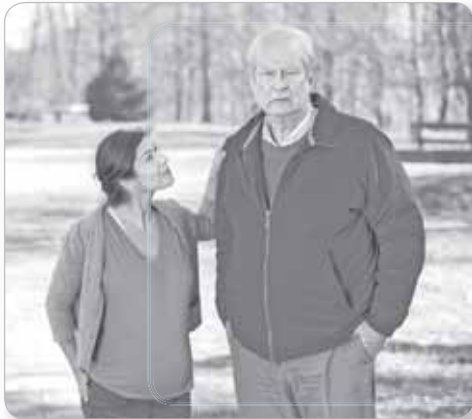
«Вторая жизнь Уве», 2015 г.

Иногда кажется, что современная кинокультура признает только молодых или средневозрастных героев до 50 лет, а дальше – забвение. Престарелые актеры выступают разве что фоном и время от времени выдают какую-нибудь мудрую мысль. Давайте вспомним фильмы, где главные роли исполняют пожилые артисты. Тем более, что 28 октября назван Днем бабушек и дедушек.