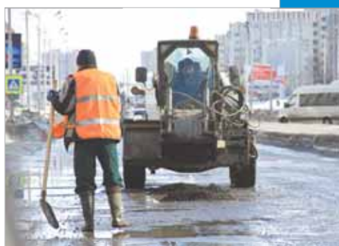
Ремонтный сезон начался