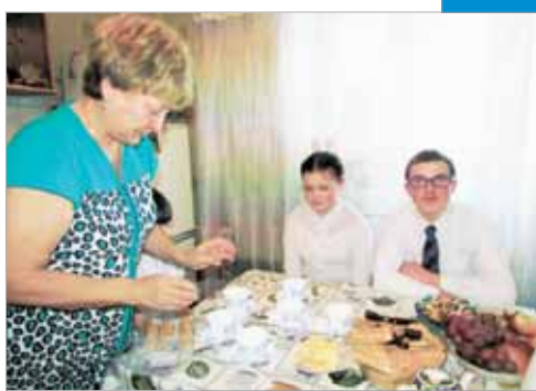
История одной семьи