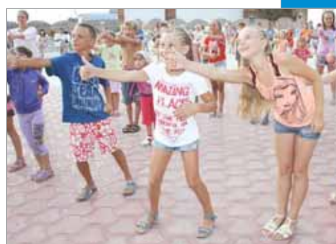
Отдыхайте на здоровье!