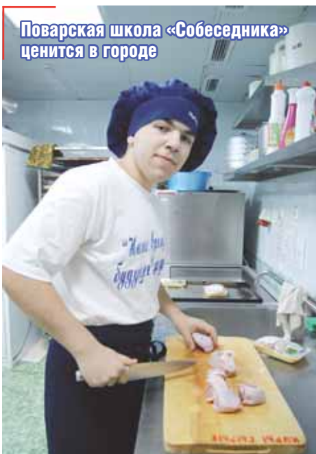
Поварская школа «Собеседника» ценится в городе

Клуб-кафе «Собеседник» заработал в 1997. Здесь молодые люди учатся работать барменами и официантами, помощниками поваров, проходят производственную практику. Сегодня кафе «Собеседник» – очень популярное место для проведения детских праздников и мероприятий. На кухне юные повара получают и применяют на практике знания о процессе обработки продуктов, приготовления разнообразных блюд. Те, кто прошел школу «Собеседника», пополняют кадровый потенциал города в сфере ре-