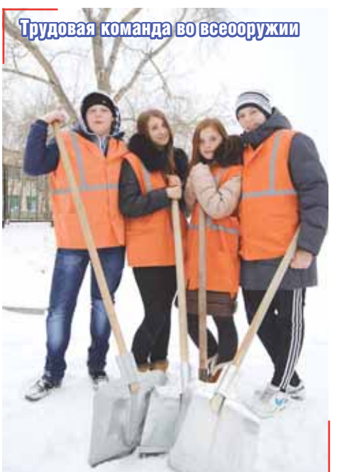
Трудовая команда во всеоружии

В Центре молодежного дизайна собирается творческая молодежь города: дизайнеры, фотографы, художники и многие другие креативные люди. Там проводятся модельные шоу с демонстрацией коллекций одежды, выставки работ воспитанников. ЦМД – это современная коммуникативная площадка для нестандартно мыслящих, равнодушных к искусству людей. Сотрудники Центра разрабатывают и организуют городские молодежные события, арт-проекты, например «Стены города» (мастер-классы по граффити), фестиваль молодежных