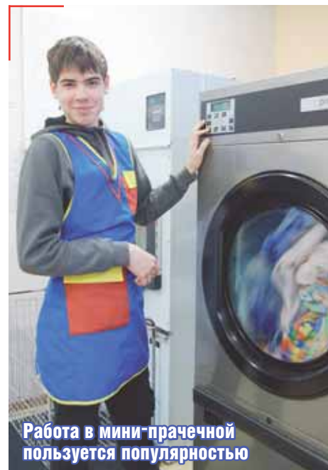
Работа в мини-прачечной пользуется популярностью

Сегодня в «НВ» трудятся чуть больше 100 сотрудников. Биржа труда устраивает на работу парней и девушек от 14