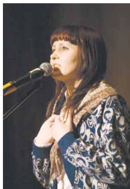
Стихи читают сердцем...