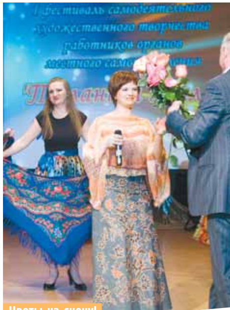
Цветы на сцену!

лик их творческий, а значит, и производственный потенциал.