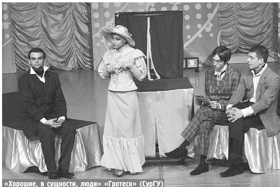
«Хорошие, в сущности, люди» «Гротеск» (СурГУ)