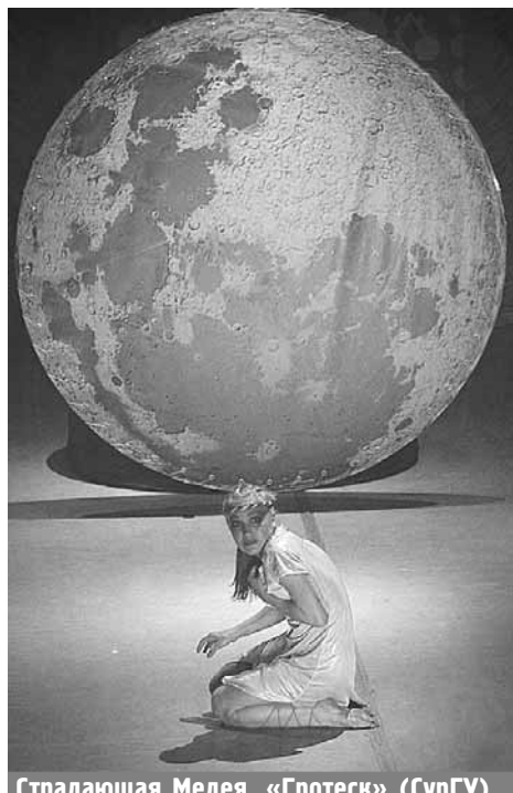
Страдающая Медея, «Гротеск» (СурГУ)

Студия моды «Образ» из Сургутского института нефти и газа на окружной «СтудВесне» не впервые. «Мы и в прошлом году были на фестивале. Пусть не все получилось, но учли все замечания, и в этот раз надеемся вы-