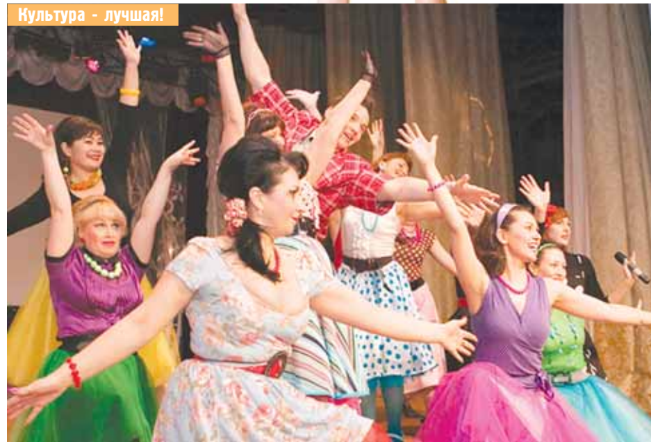
Культура - лучшая!