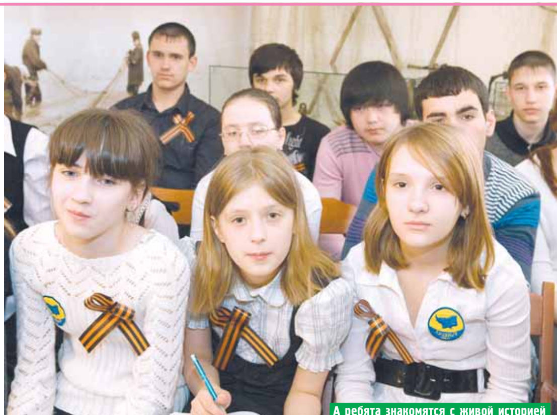
А ребята знакомятся с живой историей