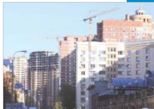
Приняты нормы проектирования