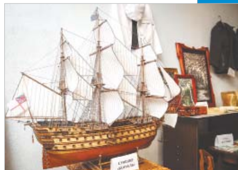
Made in colony