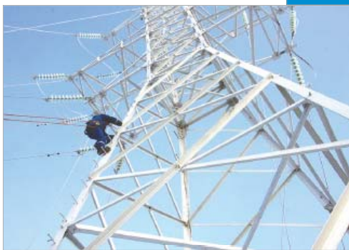
35 лет Тюменской ЛЭПи