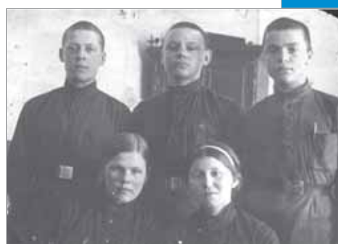
Солдаты бессмертного полка