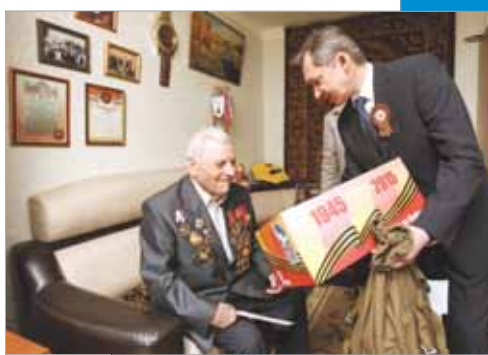
От Тюмени, Югры и Сургута