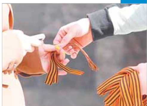
Не просто ленточка