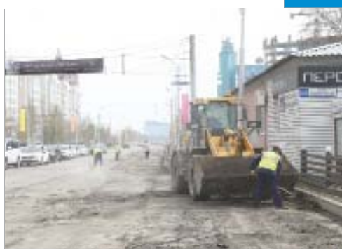
Старт ремонтной кампании