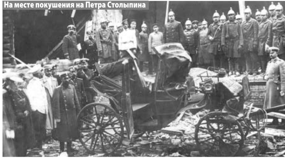
На месте покушения на Петра Столыпина

Немногим в жестокости уступали максималистам и анархисты. В агитационной газете анархистов писалось: «Вскрыть и обнажить грубый буржуазно-демократический обман, сказать сильно и ярко свое анархистское слово можно только рядом