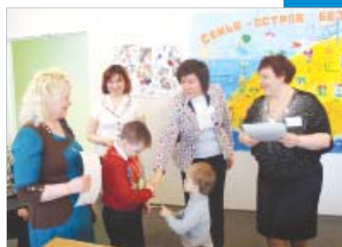
Школа для родителей