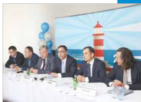
Какая пенсия вам светит