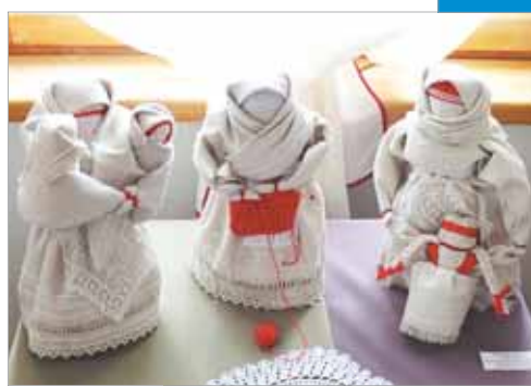
Сделать своими руками