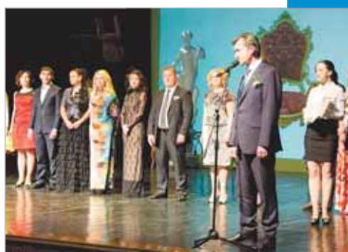
Праздник людей дела