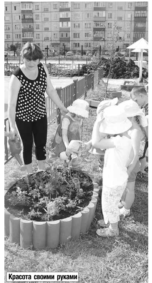
Красота своими руками

годня не все родители могут вывести своих детей за пределы города. Но и на дачах в большинстве своем малыши предоставлены сами себе. Другое дело – организованная деятельность в детском саду: и на воздухе ребенок целый день, и занят интересным занятием. Более того, мы уделяем особое внимание закаливанию и укреплению иммунитета у наших подопечных».