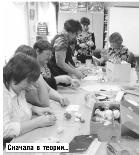
Сначала в теории...