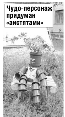
Чудо-персонаж придуман «аистятами»