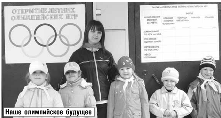
Наше олимпийское будущее