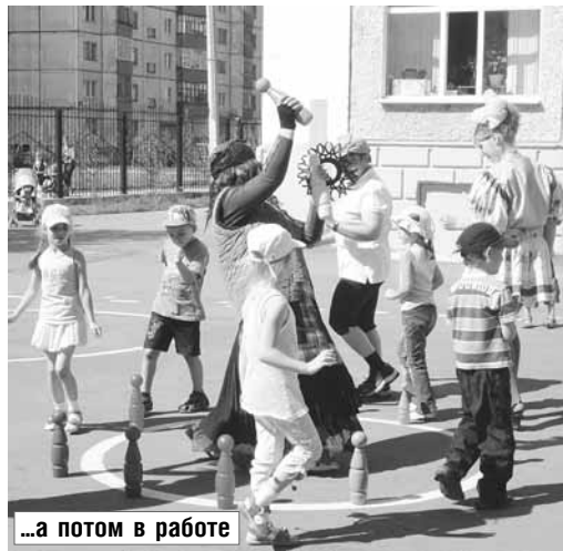
...а потом в работе