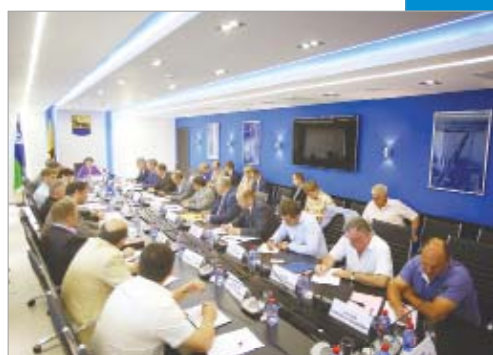
Совет в Сургуте