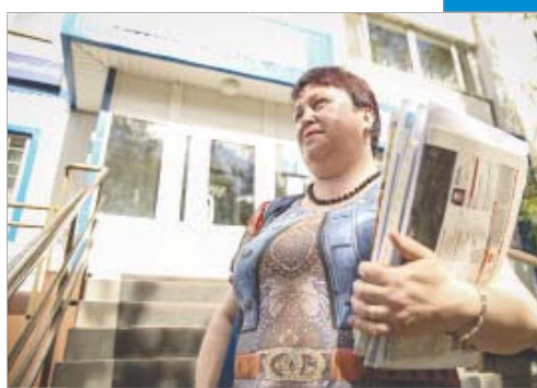
По закону привет почтальону