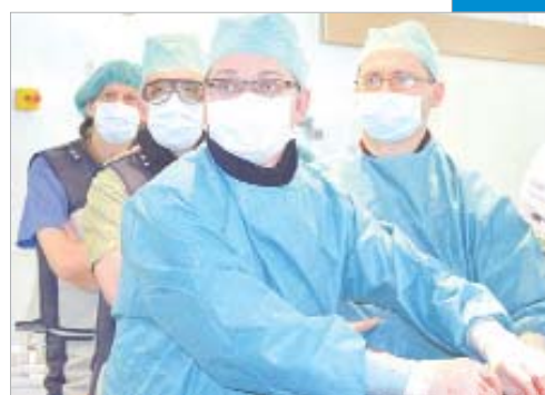
Работа на сердце