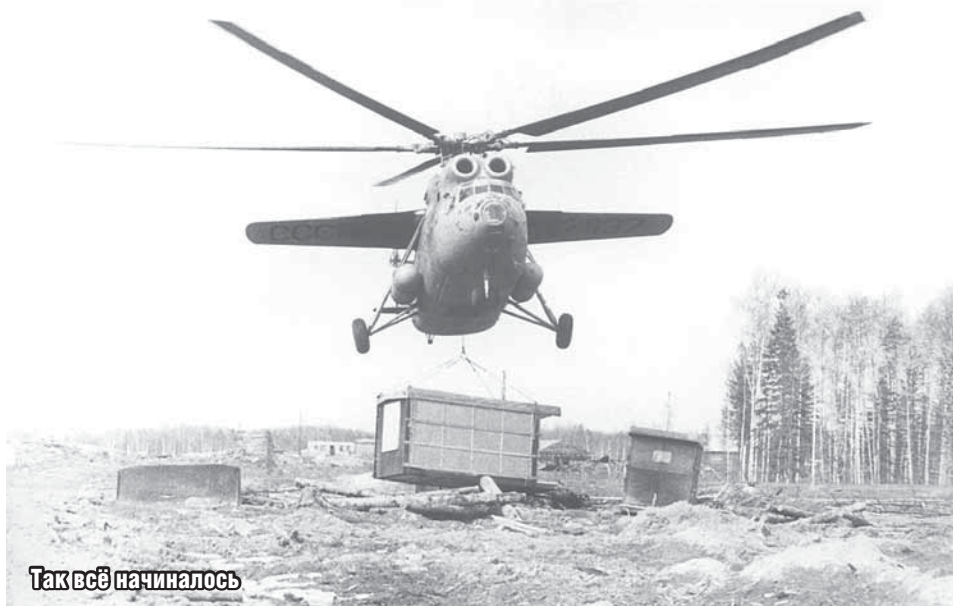
Так всё начиналось

Каждое ведомство имело свой жилой фонд, свои предприятия связи, торговли, общественного питания, бытового обслуживания, учреждения культуры и отвечало за их эксплуатацию. Эксплуатацией жилого фонда города занимались