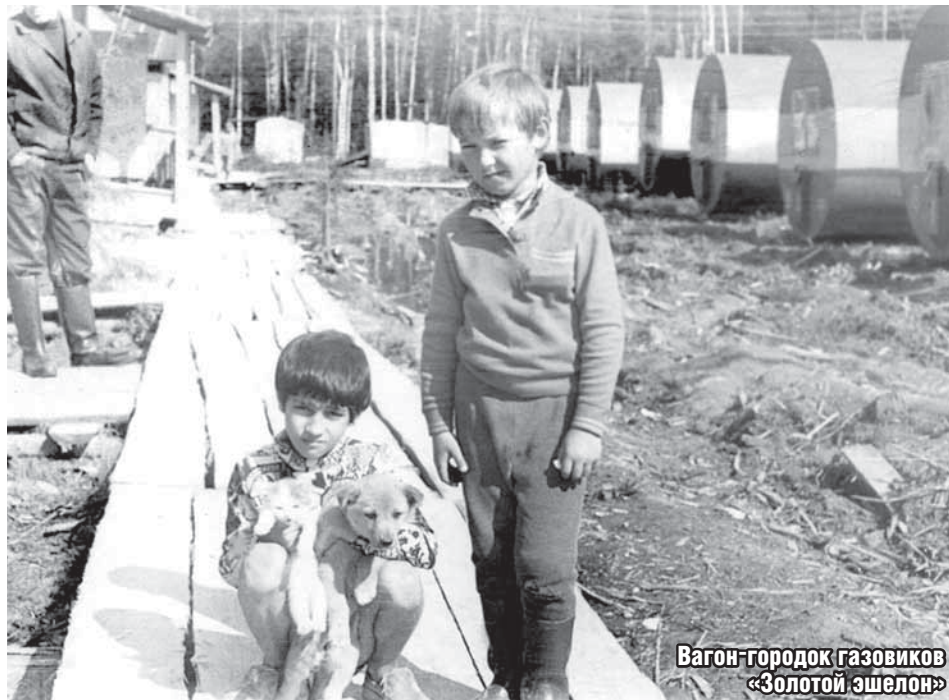
Вагон-городок газовиков «Золотой шелон»