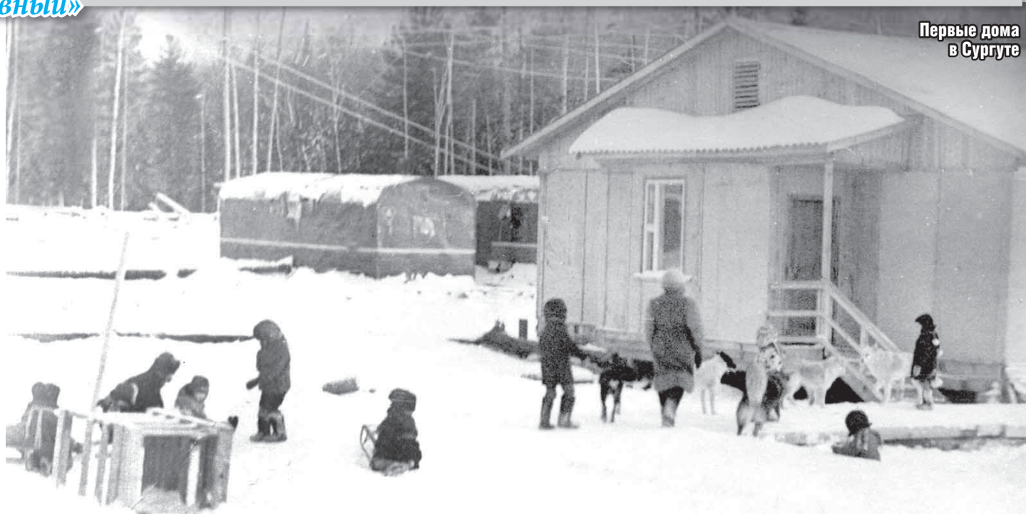
Первые дома в Сургуте