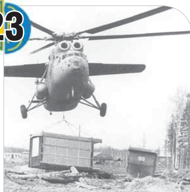
Первые дома в Сургуте