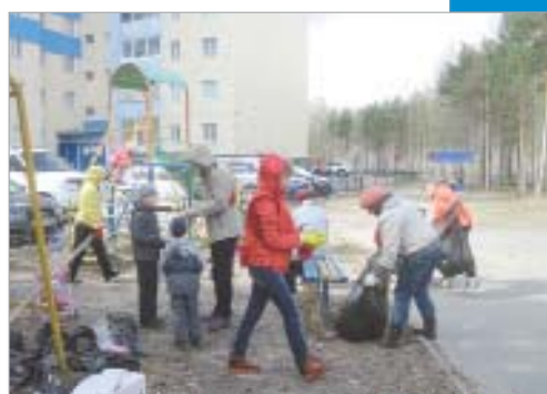
Самоуправление в каждый двор