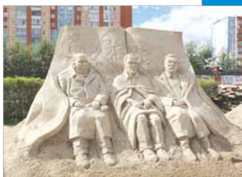
Ветер истории не развеет