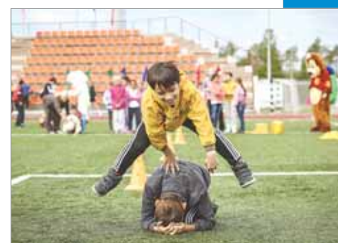
Праздник молодости и здоровья