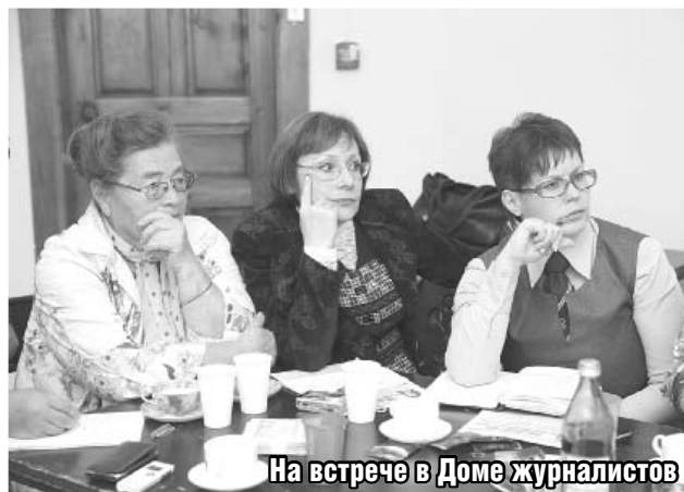
На встрече в Доме журналистов

– Это тоже жизнь заставила. Рядом был совхоз, который еле перебивался. Председатель постоянно приходил – то дай сварщика, то дай денег, то еще в чем-то помоги. Я ему говорю: что ты мучаешься, давай к нам. Они согласились.