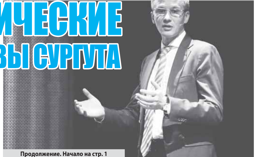
Продолжение. Начало на стр. 1

– Не совсем правильно сравнивать Калугу, Тюмень и Сургут. Это субъекты Федерации, а Сургут – муниципалитет. Возможности и за-