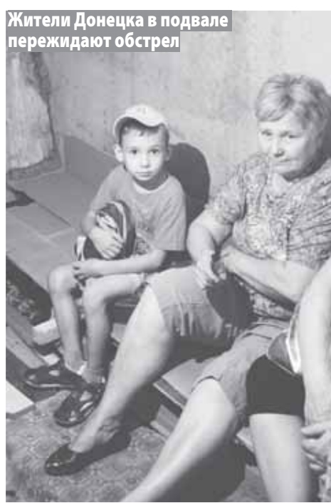
Жители Донецка в подвале пережидают обстрел

– Авдеевку, где я жил, начали бомбить. Обстреливать «Градами». Залпом «Града» были разрушены шесть жилых домов недалеко от моего дома.