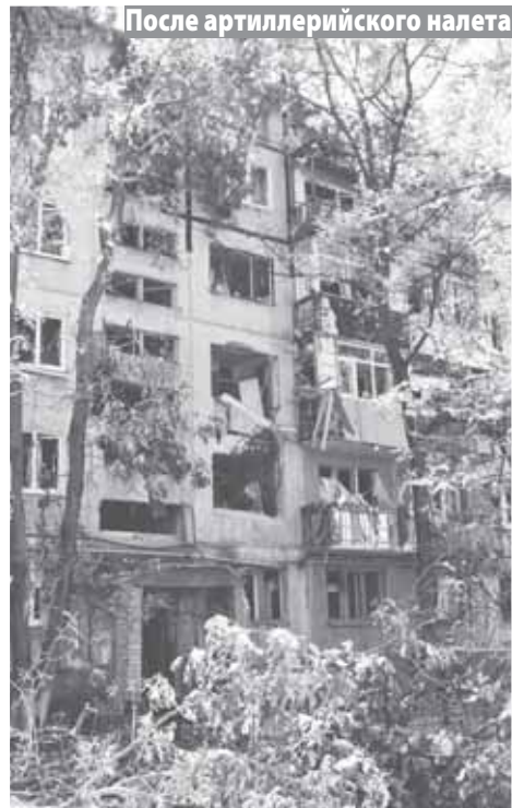
После артиллерийского налета

– Да, смотрели со стороны. Ну, проходит какая-то акция, кому-то это нужно. Никто не считал, что это может закончиться чем-то серьезным. Какой смысл выступать против Януковича, когда в сентябре должны быть выборы? Ради того, чтобы он ушел на полгода раньше, разве стоило организовывать переворот и войну? Сейчас понятно, что был план по его свержению, но большинство на Украине об этом плане ничего не знали.