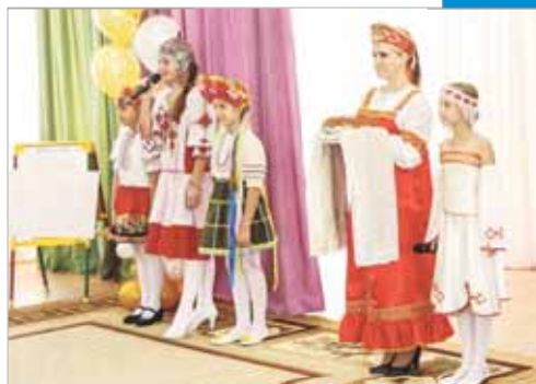
Еще два детских сада!