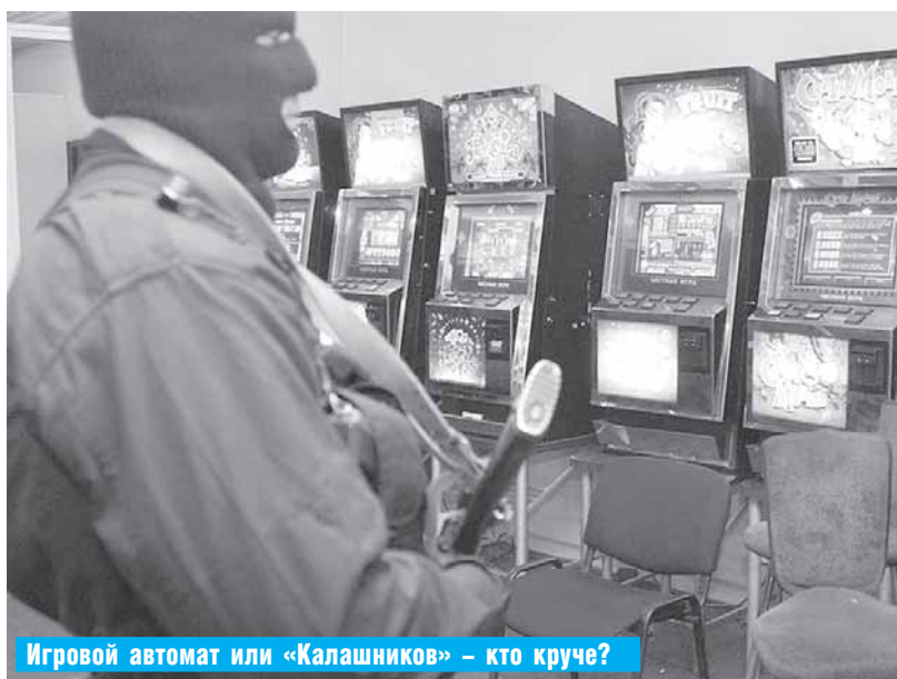
Игровой автомат или «Калашников» — кто круче?

За январь–сентябрь 2010 года было отправлено на экспертизу 1080 единиц игрового оборудования, проверено 167 торговых объектов, составлено 85 административных протоколов. Наложено штрафных санкций на сумму 22 850 рублей. Убрали добровольно после привлечения к административной ответственности 24 «столбика». Повторно изъято 18 единиц игровой техники. Последнее изъятие игрового оборудования произошло в ТК «Империю» — конфисковано 30 автоматов.