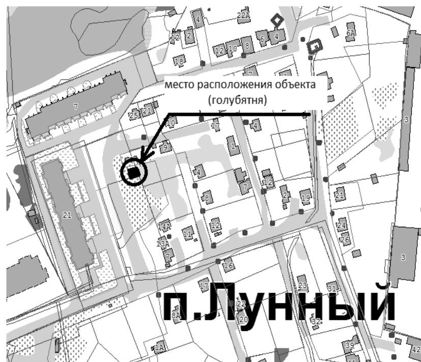
Схема расположения нестационарного объекта синего (голубятня), самовольно установленного во дворе многоквартирного жилого дома №21 по ул. Аэрофлотская в поселке Лунный.