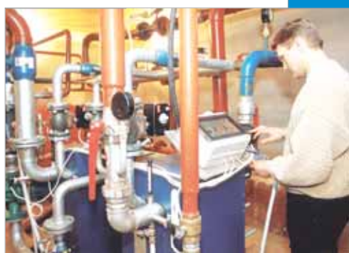
Тепло растеклось по трубам