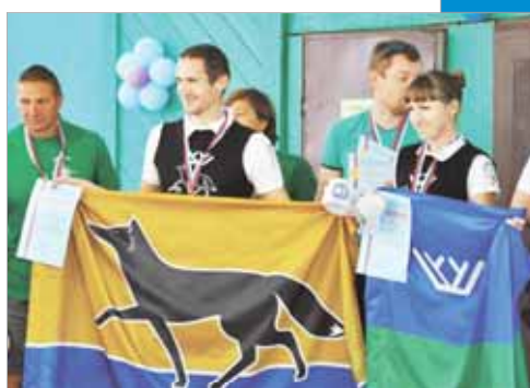
«Чёрный лис» не подведёт