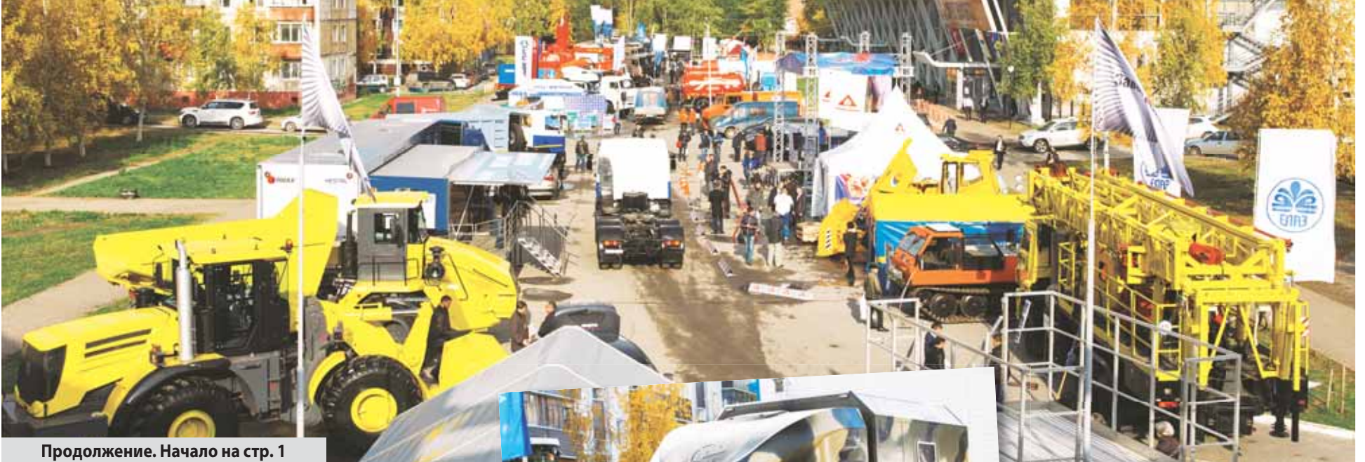
Продолжение. Начало на стр. 1