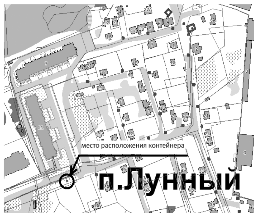
Схема расположения металлического контейнера коричневого цвета, самовольно установленного напротив торца дома № 21 по улице Аэрофлотская.