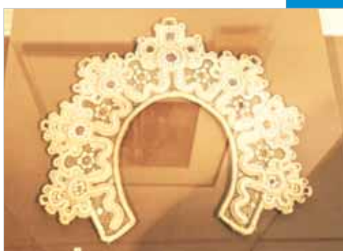
Красота из XIX века