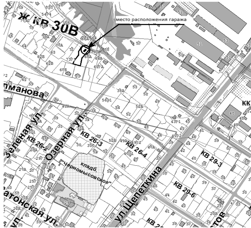
Схема расположения самодельного металлического гаража зеленого цвета, самовольно установленного в 30 В микрорайоне на участке №61, между земельными участками №65/А и №73/1 по ул. Терешковой.