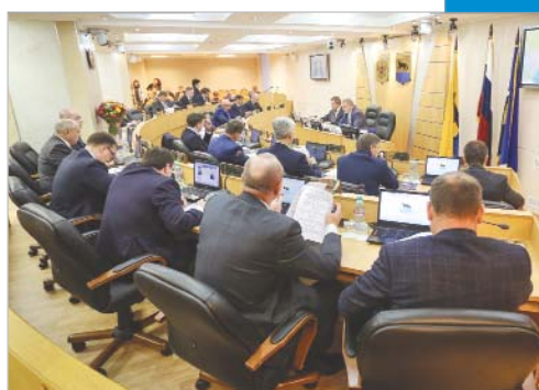
Дума города: каникулы кончились