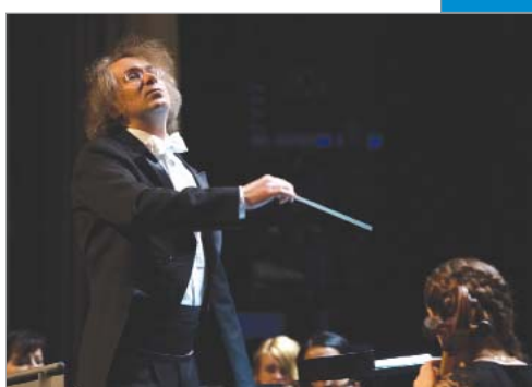
Музыка на «60-й параллели»