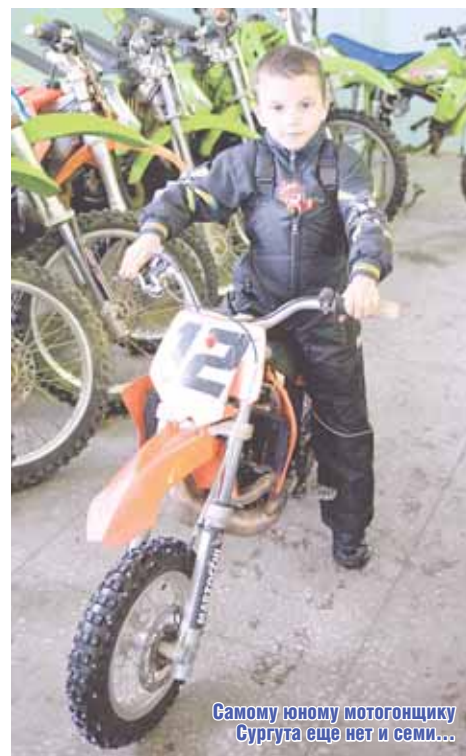
Самому юному мотогонщику Сургута еще нет и семи...

Технические виды спорта ждут своего часа, точнее – своего места