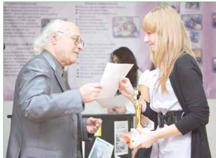
Почетная награда – из рук корифея сургутской журналистики