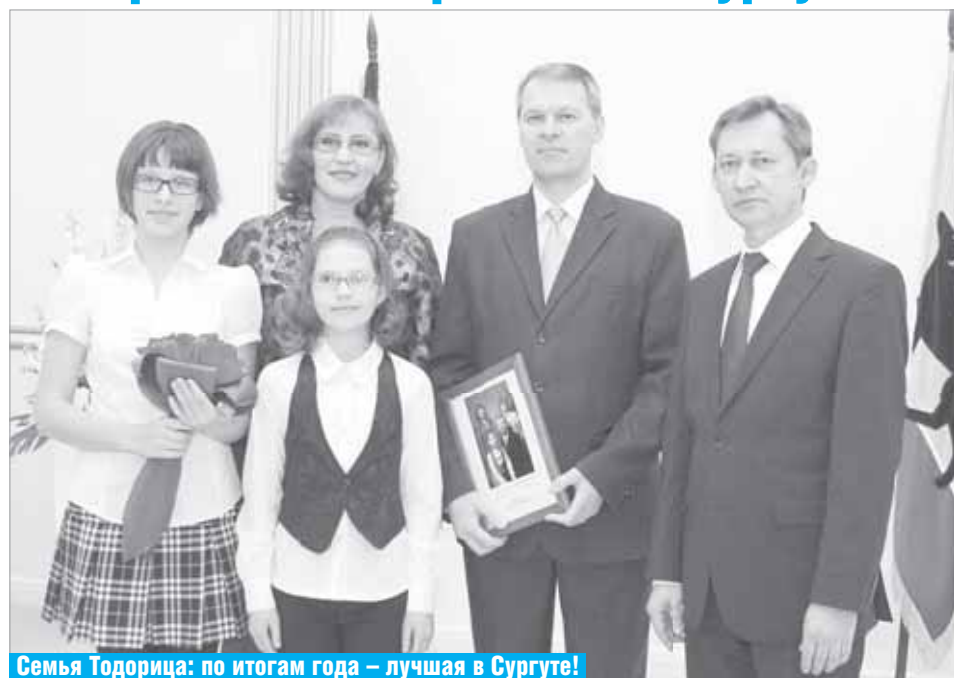
Семья Тодорица: по итогам года – лучшая в Сургуте!