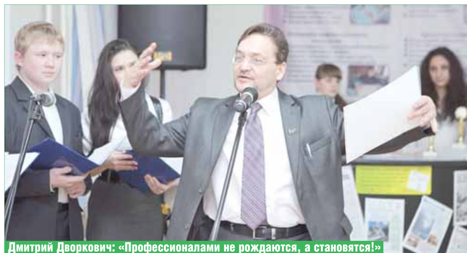
Дмитрий Дворкович: «Профессионалами не рождаются, а становятся!»