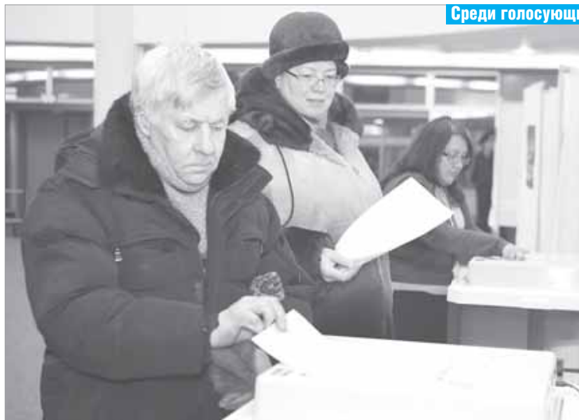
Среди голосующих – и стар и млад!

Дмитрий ОСЬМИНКИН, Андрей АНТРОПОВ