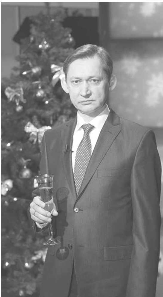
Глава города Сургута Д.В. Попов

спортивных сооружений на территории пришкольных участков. Существующих сегодня спортзалов образовательным учреждениям не хватает – в связи с дополнительными уроками физкультуры, предписанными программой с нового учебного года. К 1 сентября 2012 года мы планируем ввести эти объекты, а на три года у нас таких объектов запланировано 9! Каждый объект обойдется примерно в 60 млн рублей.