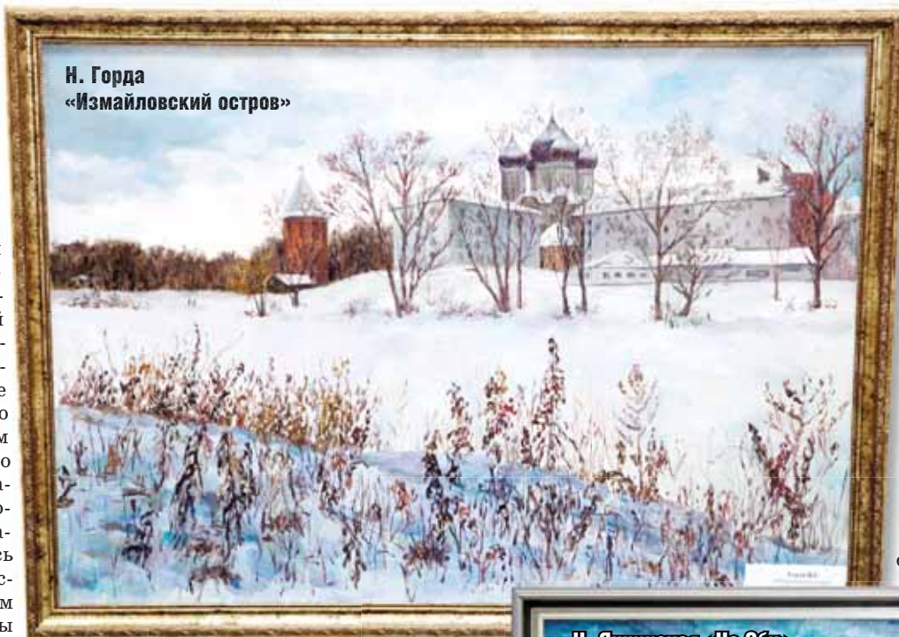
Н. Горда «Измайловский остров»