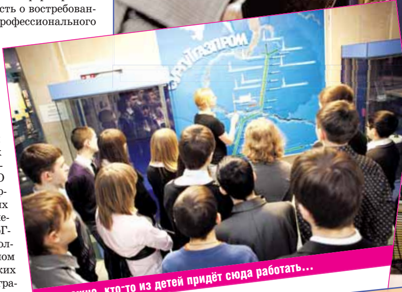
Возможно, кто-то из детей придёт сюда работать...