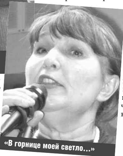
«В горнице моей светло...»

Разговор о том, что поэты уходят, а стихи остаются, мало утешают – настоящего Поэта заменить не кем. На могиле Рубцова стоит памятник. На мраморной плите – бронзовый барельеф. У подножия памятника выбита на камне строка поэта: «Россия! Русь! Хра-