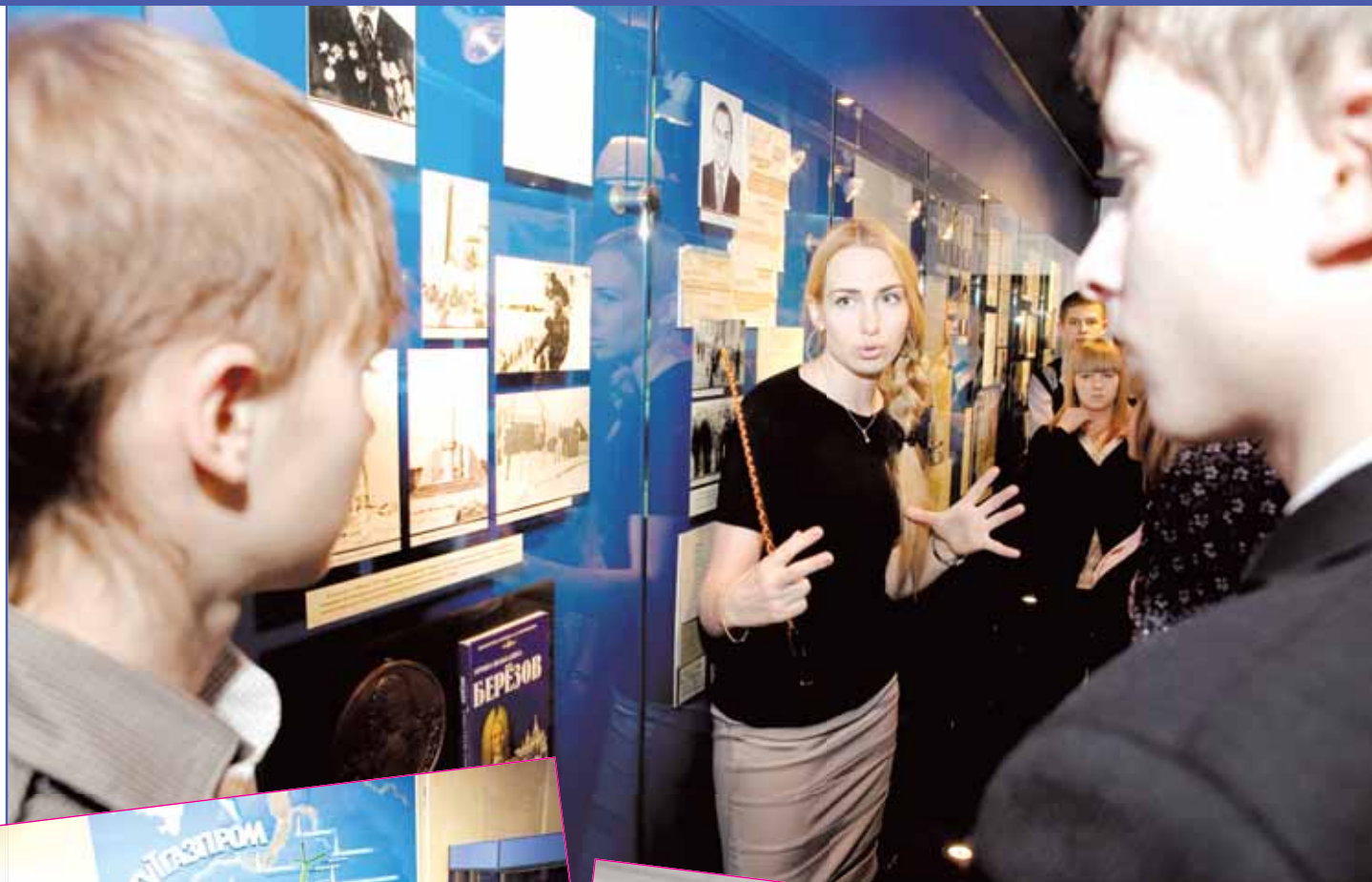
На экскурсии в музее Газпрома

Как было сказано выше, с 15 февраля и до 14 апреля пройдет целая серия мероприятий. Старшеклассники побывают на экскурсиях в Сургутском институте нефти и газа, в ООО «Газпром трансгаз Сургут», на предприятиях Сургутнефтегаза, в Тюменьэнерго, СурГУ и СурГУ-ПУ, медицинском колледже, СПК и нефтяном техникуме, в Городских тепловых сетях, в типографии и ТРК «Сургутинтерновости». Пройдут брифинги, диспуты по профессиональным направлениям, открытые занятия в университетах, презентации профилей и даже профориентационный «брейн-ринг». Центр индивидуального развития организует пиар-акцию «Мой выбор», слет «Под