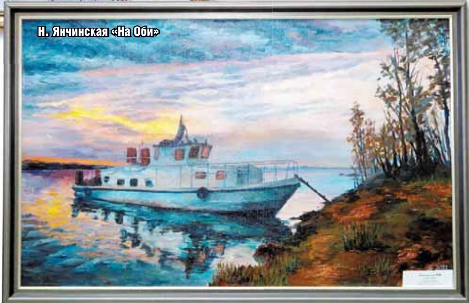
Н. Янчинская «На Оби»