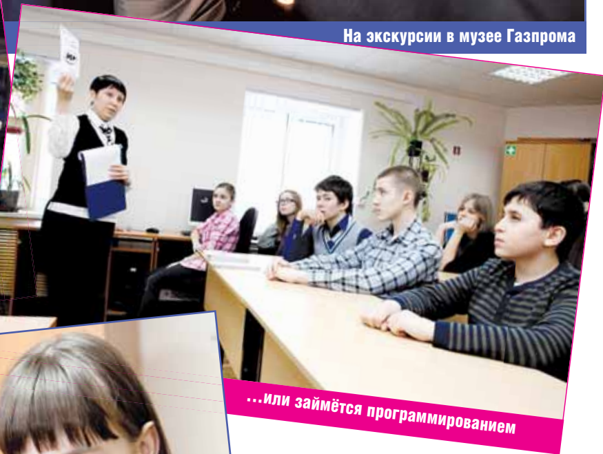
...или займётся программированием