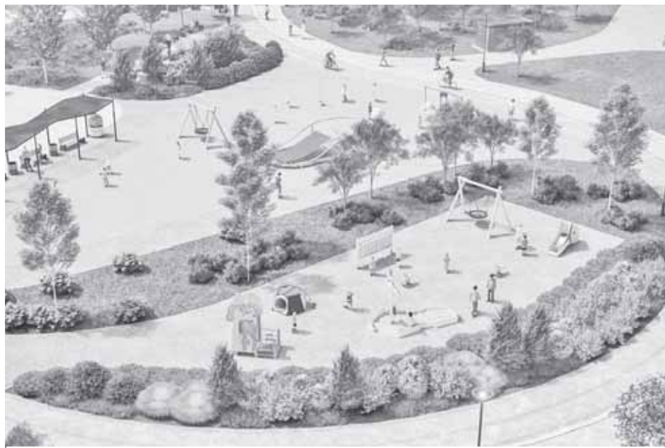
Проект парка в 8 мкр Сургута

В прошлом году на территории парка в 8-м микрорайоне устроили спортивную зону: тренажёры соседствуют с многофункциональной спортивно-игровой площадкой. Объект пользуется интересом жителей ближайших домов.