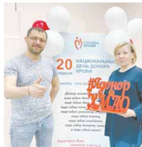
Донорами крови и её компонентов в 2022 году стали 6815 сургутян

«нового поколения», кто вырос в условиях информационной доступности. Они становятся донорами осознанно, зная, как нужно готовиться к процедуре и какие есть противопоказания.