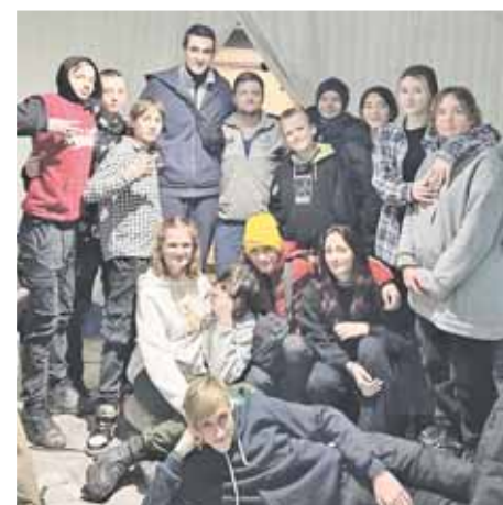
Во временном пункте обогрева