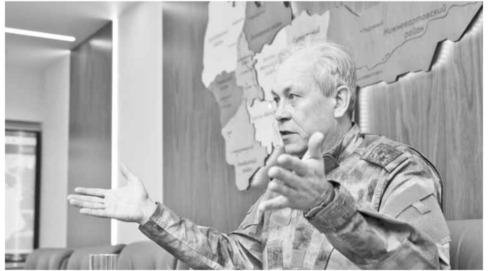
Эдуард Басурин открыт к общению даже в жестях

– Верховный командующий подписал распоряжение, что армия РФ нуждается в увеличении сухопутных войск. Есть конкретная цифра – 400 тысяч военных. И команда должна быть выполнена. Мы не знаем всего, что происходит, но подчеркну: приближение противника в виде НАТО к границам РФ – это факт.