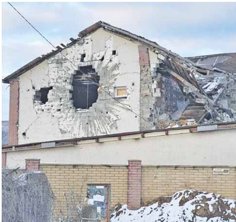
Здесь жили люди