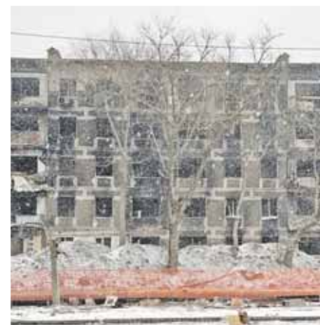
Мариуполь, февраль 2023 года