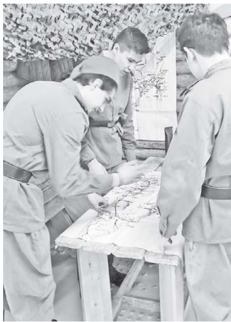
Один из этапов маршрутно-ролевых учений