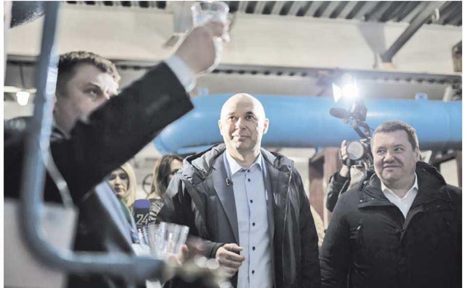
Глава города Андрей Филатов оценивает на вид и вкус воду после очистки

Процесс центрального водоснабжения в Сургуте обеспечивается тремя участниками цепочки: ресурсоснабжающая организация СГМУП «Горводоканал», в ведении которой магистральные трубопроводы, пять предприятий, отвечающих за внутриквартальные сети, и управляющие компании, в чьей