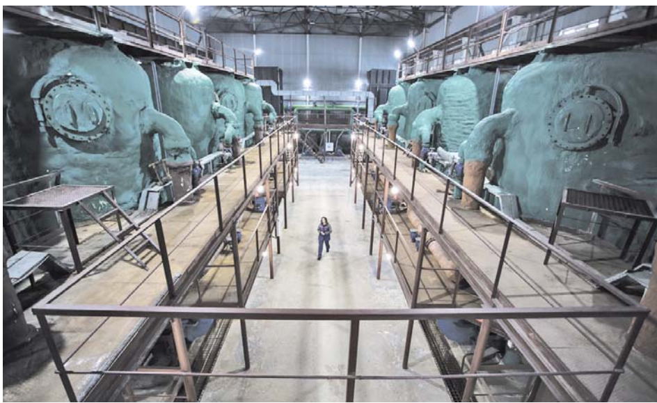
Внутри станции водоочистки

михайловского водоносного слоя на глубине 150-170 метров, то Сургут пошёл ещё дальше. Вода в наших кранах – напрямую из глубинного слоя подземных вод Олигоценового комплекса, защищённого слоем вечной мерзлоты. Это та реликтовая вода, залегающая на глубине 300 метров от поверхности, которая, по всей видимости, видела мамонтов и динозавров. У неё совершенно нет никакой связи с поверхностью.