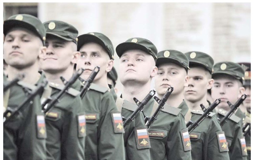
Лимит весеннего призыва на срочную службу – 1600 югорчан 1996–2005 годов рождения

– Мы принимаем всех, но в том случае, когда желание человека совпадает с его возможностями. Главный критерий – состояние здоровья. Кроме того, причиной для отказа может по-