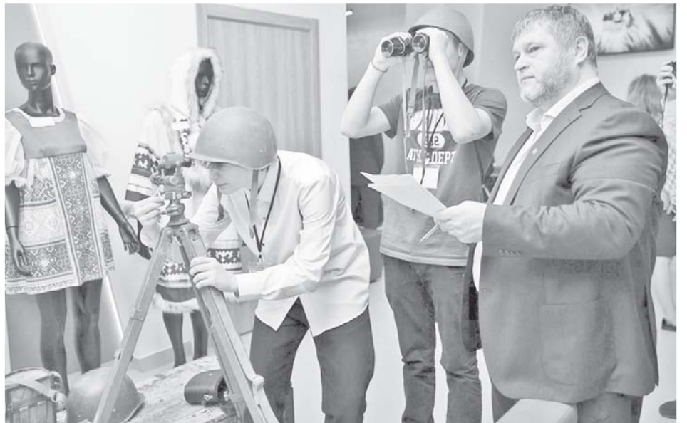
В исторических учениях приняли участие 96 школьников

– С подачи наших партнёров – федерального музея «Бородино» Министерство культуры РФ пригласило нас пред-