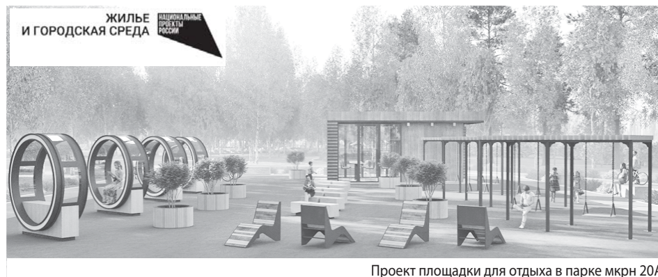
Проект площадки для отдыха в парке мкрн 20А

Четыре общественных пространства Сургута претендуют на финансирование из федерального бюджета: парк в микрорайоне 8 на улице Республики, сквер на пересечении бульвара Свободы и проспекта Ленина (2 этап строительства, устройство тротуаров), сцена и спортивная площадка в парковой зоне в микрорайоне 20А. Рейтинговое онлайн-голосование продлится до 31 мая.