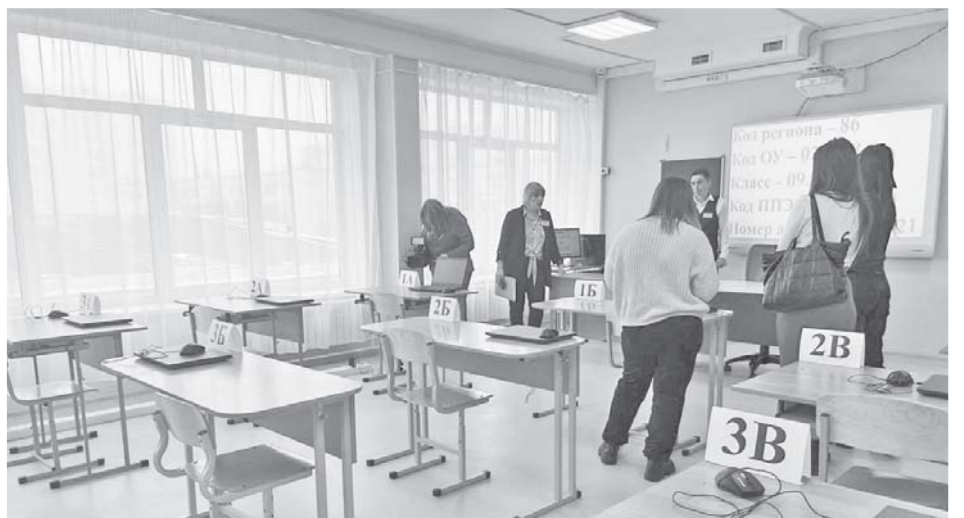
Сдавать экзамен по информатике хотят 50% выпускников 9-х классов – одна из самых популярных дисциплин

– В этом году итоговая аттестация для девятиклассников стартует 24 мая и продлится до 1 июля. Ежегодно