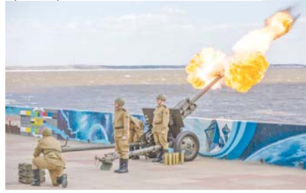
Артиллерийский залп в честь Дня Победы