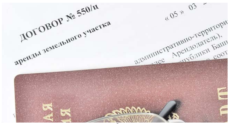
Сургутские предприниматели копят долги за аренду

Представитель судебных приставов предложила проводить совместные с администрацией рейды по взысканию задолженности. Уже в ближайшее время такой вариант опробуют на 12