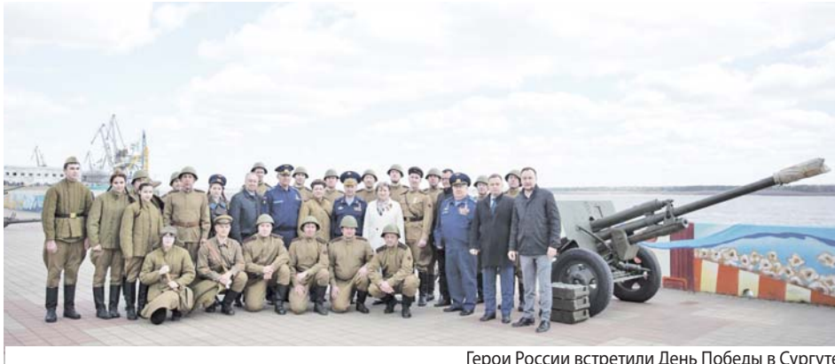
Герои России встретили День Победы в Сургуте