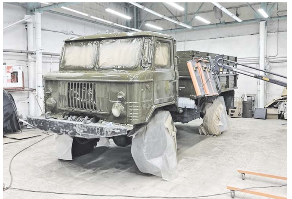
Легенда пограничных войск готовится стать памятником