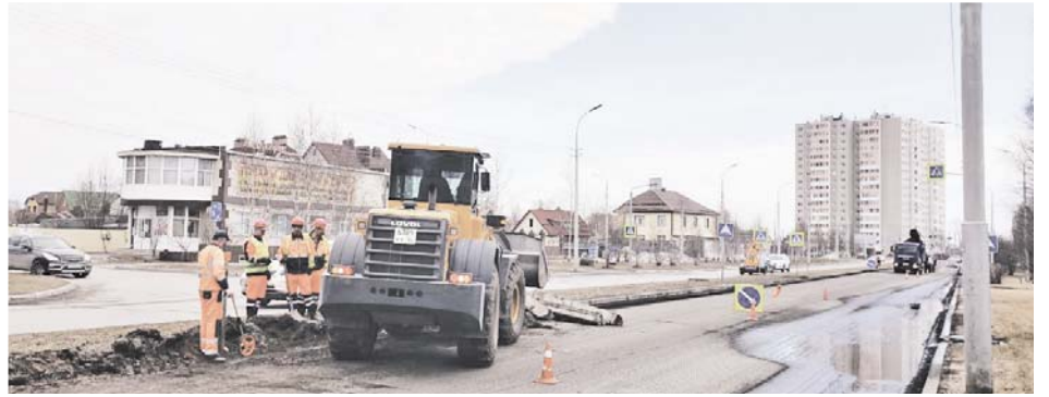
На пр. Комсомольском начался ремонт дороги

В рамках соглашения окружных властей с недропользователями ремонт улично-дорожной сети в Сургуте включает также ПАО «Сургутнефтегаз». Текущий год – не исключение. В планах ремонтной кампании – обновить дорожное полотно на проспекте Мира, от Лермонтова до Островского в обоих направлениях, в том числе – внутриквартальный проезд до Прогимназии на бульваре Писателей. Силами ПАО «СНГ» приведут в порядок асфальт на ул. Пионерной