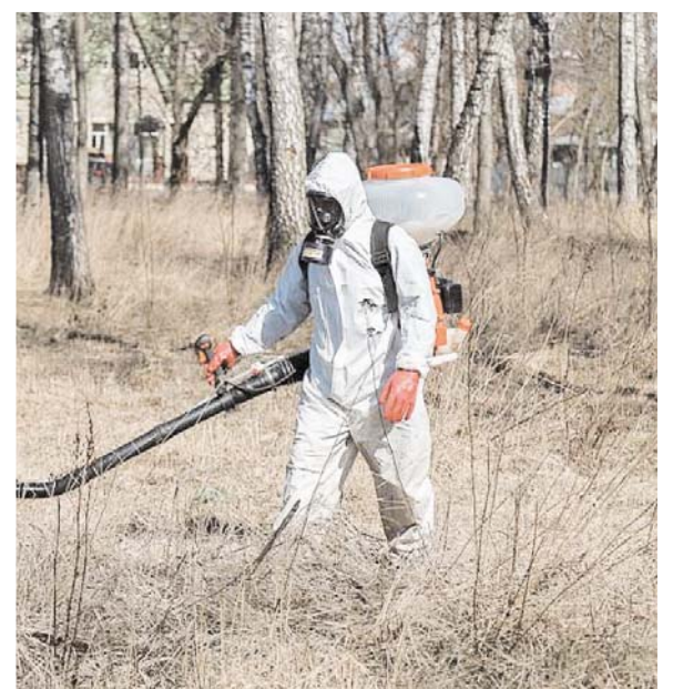
Будет обработано 309 зелёных зон

Отметим, что с начала года в Югре зафиксировано уже 36 случаев укуса клещами, три из них в Сургуте. Роспотребнадзор напоминает: если паразит присосался к коже, то его надо очень аккуратно извлечь, а место укуса продезинфицировать. После чего – отнести насекомое в лечебное учреждение для исследования на заражённость инфекцией. В Сургуте такие исследования проводят в Центре гигиены и эпидемиологии на улице Кукуевецкого и клиниках «Инвитро».