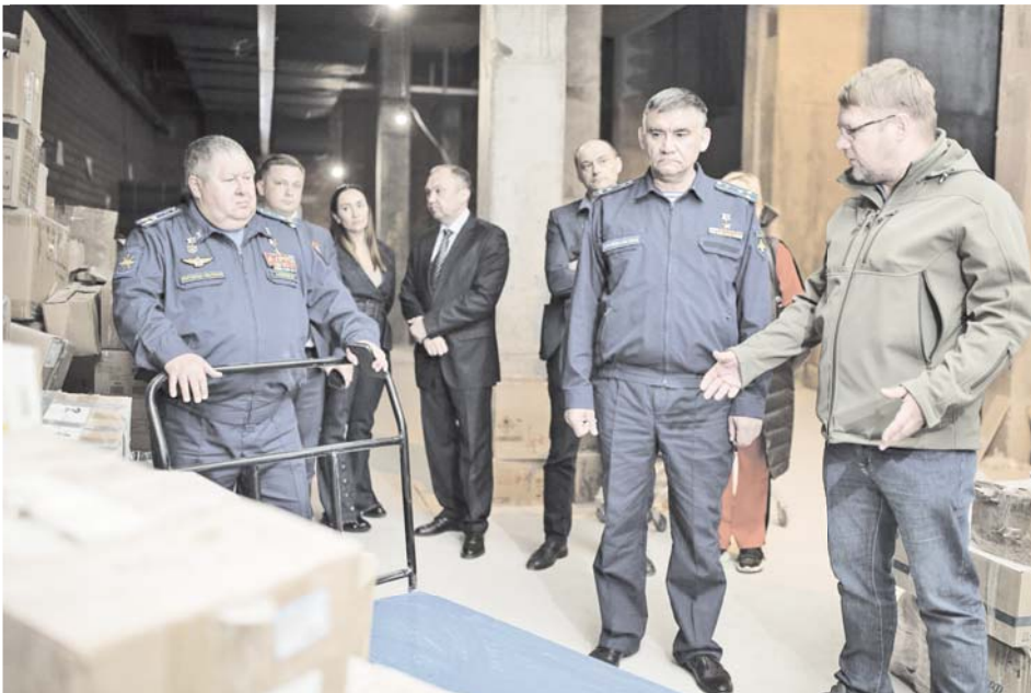
Почётные гости посетили центральный склад гуманитарной помощи для жителей Донбасса и ЛНР

– Я сын фронтовика, у меня перед глазами был пример мужества людей, прошедших войну. Мужчина без обеих ног работал почтальоном, без руки сено косил, другой был кузнецом. Как я мог не стать патриотом? Могу ещё добавить, что