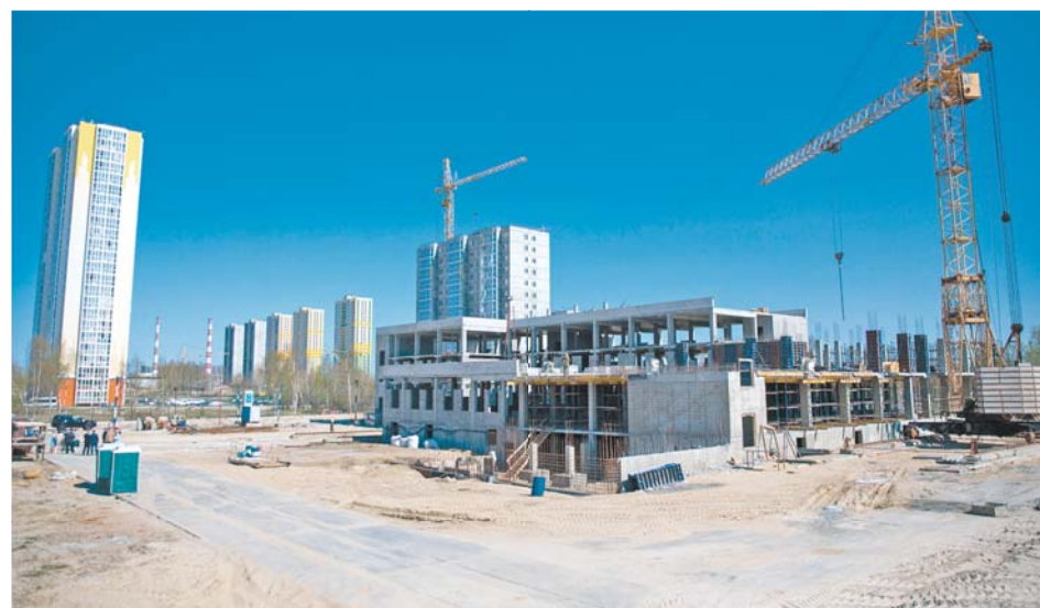
Готовность детского сада в микрорайоне «Голд Фиш» – 33%

РЯДОМ С НОВЫМИ ЖК РАЗВИВАЮТ СОЦИАЛЬНУЮ ИНФРАСТРУКТУРУ