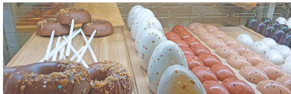
Авторские десерты – отличительная особенность студии кофе и шоколада

В прошлом году ИП получил субсидию и частично возместил расходы на аренду, за «коммуналку» и приобретение нового оборудования. Пакет документов на получение очередной финансовой помощи в этом году (по результатам прошлого) у него уже готов.