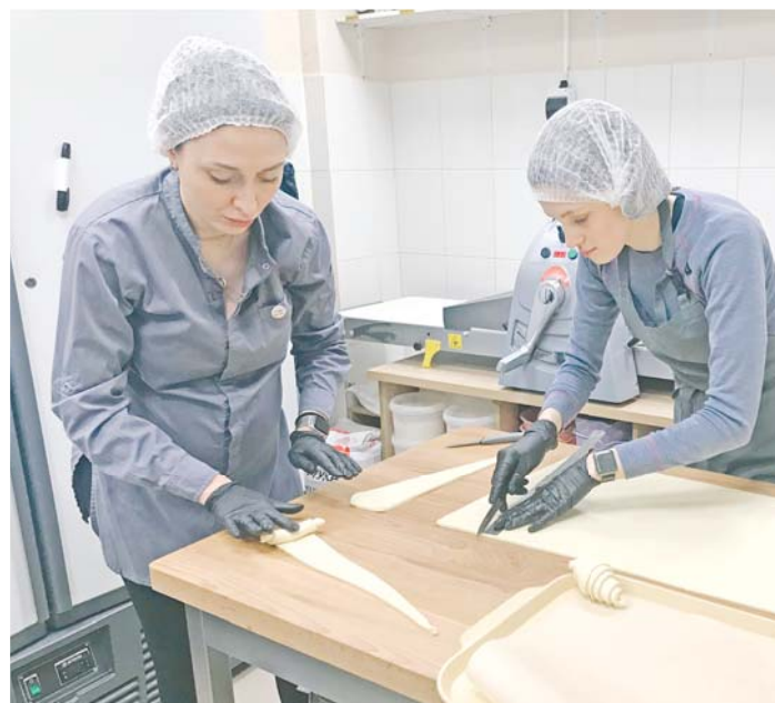
Машина для раскатки слоёного теста приговорила полуфабрикат, который скоро станет хрустящим круассаном.

– В ассортименте у нас много авторской продукции, которая готовится вручную. И различные десерты, и шоколадные конфеты, и горячие напитки на основе фруктовых пюре, ну и, конечно, кофе из высококалассного сырья. Всё сырьё на нашем производстве натуральное. А особенностью нашей студии кофе и шоколада являются уникальные коллекции шоколадных изделий, которые мы стилизуем под разные праздники, – расхваливает свой товар хозяин бизнеса.