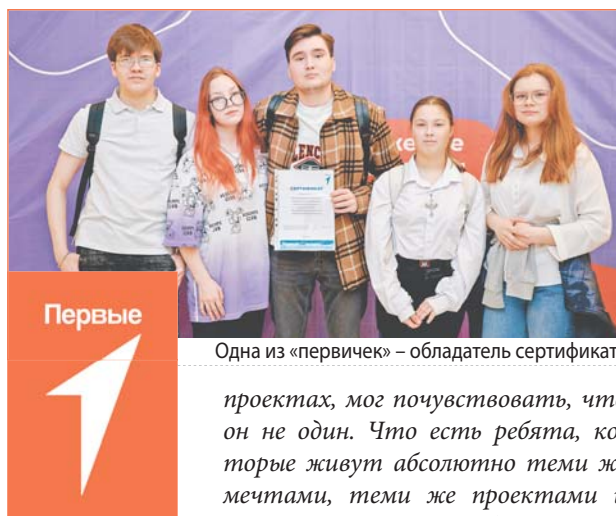
Одна из «первичек» – обладатель сертификата

– 16 тысяч активистов по всему региону, каждый из которых архитектор того, где мы будем жить – в каком городе, округе, стране. Очень важно понимать: приходя в Движение, каждый получит максимум возможностей, а мы, взрослые, поддержим и поможем стать частью общей команды. Главное, чтобы каждый, работая в Движении и его