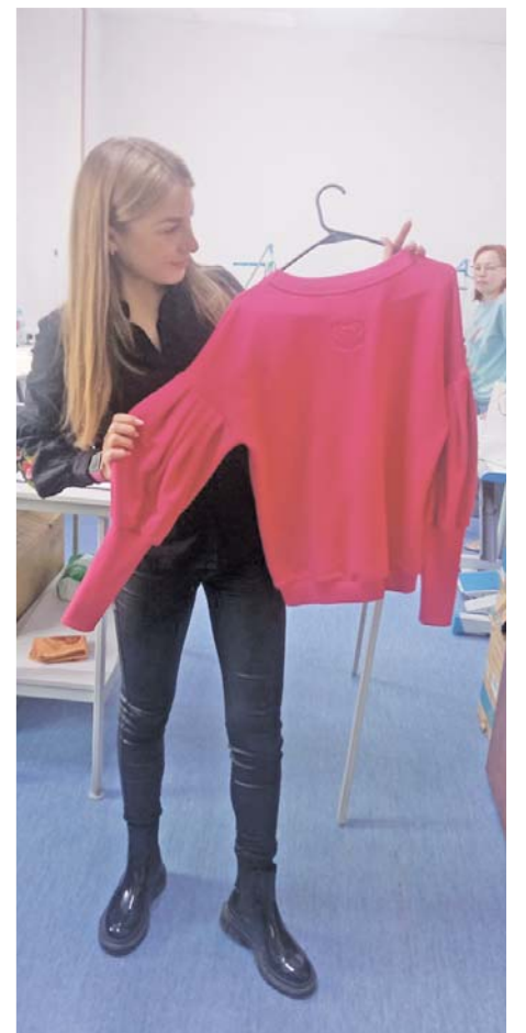
Логотип вышивается вручную на прямострочной машине