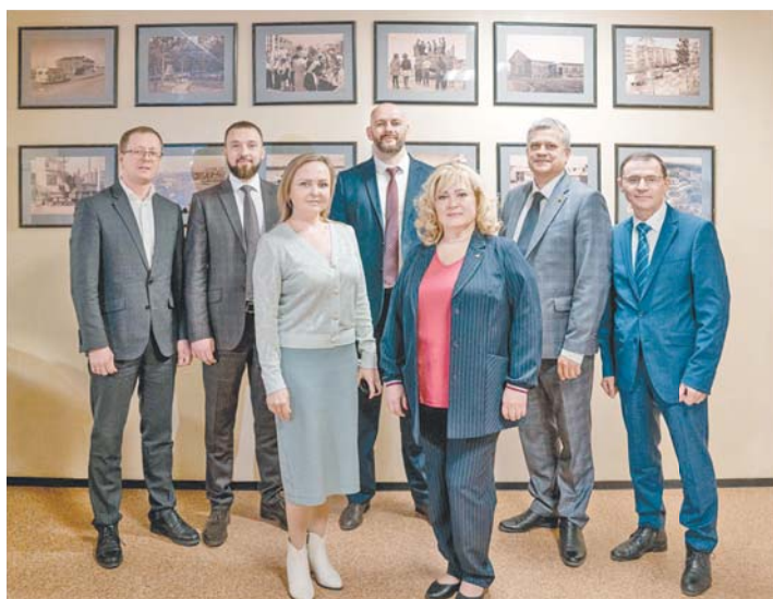
Участники Координационного совета по развитию сургутской агломерации