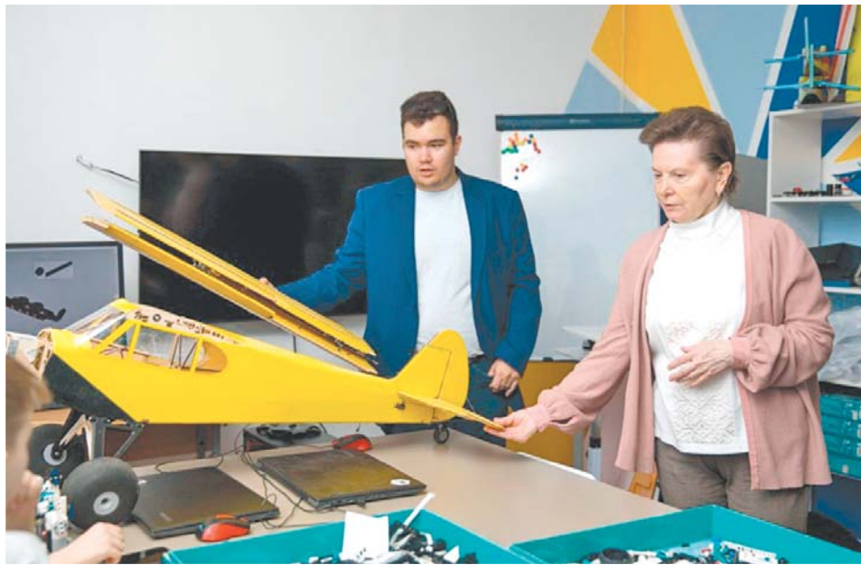
В Центре молодёжного инновационного творчества

Глава Сургута Андрей Филатов отметил, что при реализации градостроительной политики город активно использует Югорский стандарт комплексного развития территорий. «Сургут первым в Югре начал реализацию договоров о комплексном развитии территорий, – сказал глава города. – В 2023 году город приступает к комплексной корректировке документов стратегического и территориального планирования. Ведётся работа по регулированию качественных характеристик и внешнего облика элементов среды и размещения рекламных конструкций. Определены правила размещения