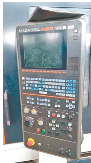
Рабочие процессы автоматизированы и роботизированы