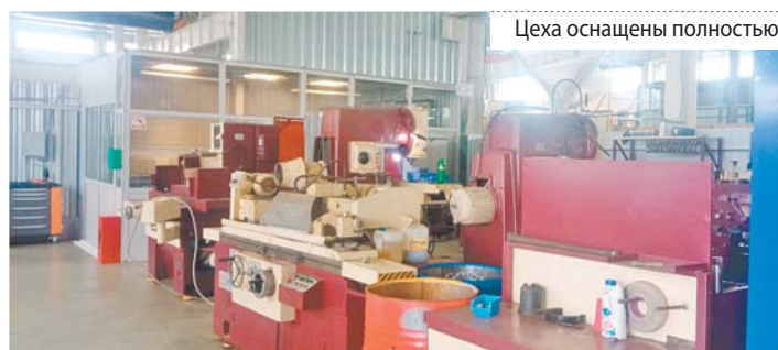
Цеха оснащены полностью