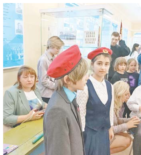
Письма детей согревают в самые отчаянные минуты

«Здравствуй, дорогой солдат, пишет ученик 6 класса школы № 22. Я хочу сказать тебе спасибо за отвагу, несокрушимую смелость на поле боя. Я очень горжусь вашим подвигом, каждый освобождённый город, село – это