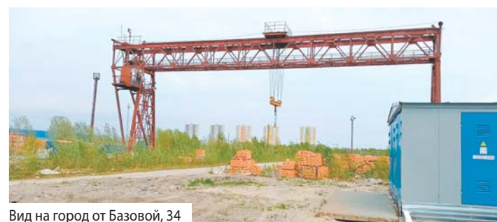
Вид на город от Базовой, 34