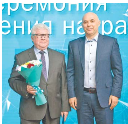
31 сотрудник СурГУ отмечен наградой