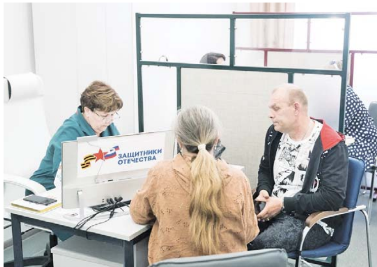
Для персонального сопровождения подопечных сформирован целый штат координаторов, прошедших специальное обучение

Специалисты Фонда будут вовлекать ветеранов спецопера-