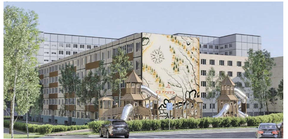
Визуализация исторического маршрута