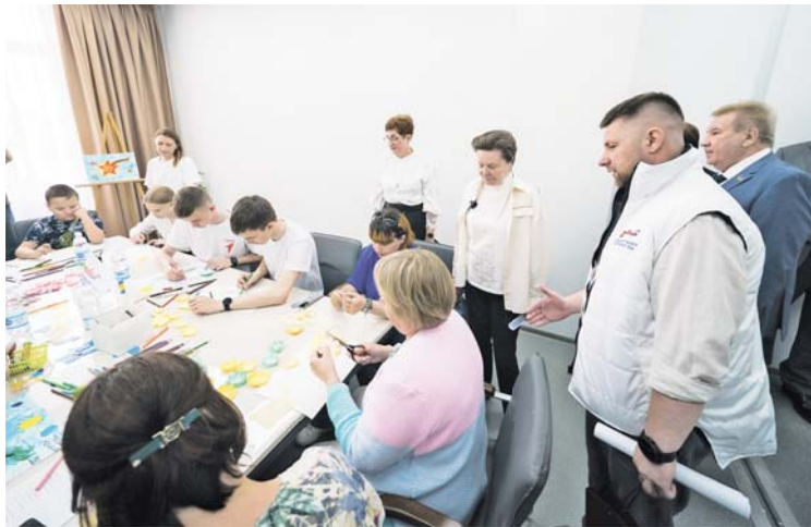
Губернатор Югры Наталья Комарова лично оценила техническую базу центра

– В своём послании президент России Владимир Путин подчеркнул: «Семья каждого участника специальной военной