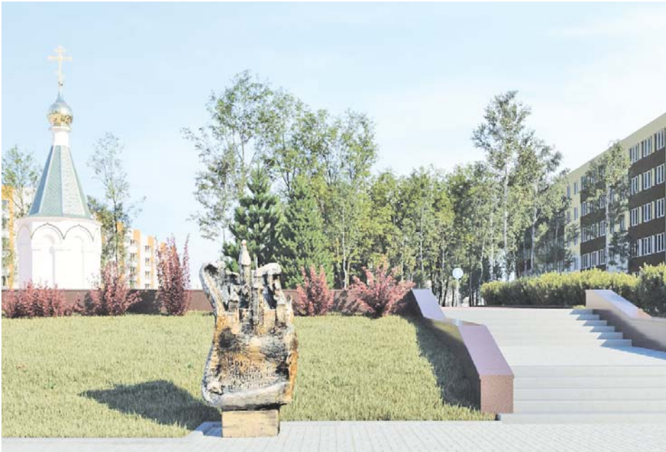
Так будет выглядеть памятный знак