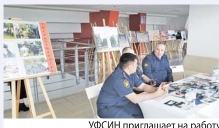
УФСИН приглашает на работу