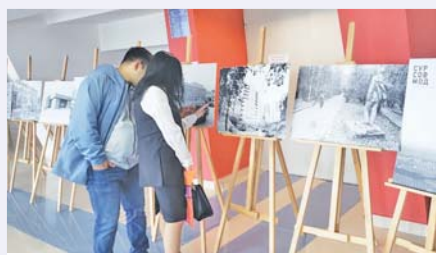
Экспозиция выставки «СурСовМод»

– Мы принимали участие в разнообразных ярмарках вакансий, подыскивали кандидатов и находили новые кадры. Но в таком масштабном участвуем впервые. Сегодня уже подходили молодые люди, знакомилась с условиями поступления на службу в уголовно-исполнительную систему, смотрели наглядные материалы и взяли телефоны для связи. Будем их ждать с документами в отделе кадров.