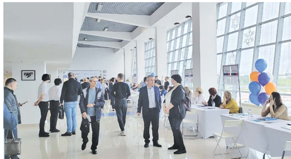
На ярмарку вакансий люди начали собираться ещё до открытия

– У выпускников школ сегодня идеальная возможность пройти и