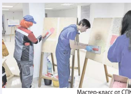
Мастер-класс от СПК

На ярмарку вакансий пришли самые разные посетители: от школьников и студентов, которые только выбирают профессию для будущей жизни, до взрослых опытных людей, кто решил изменить место работы, специальность или открыть собственный бизнес.