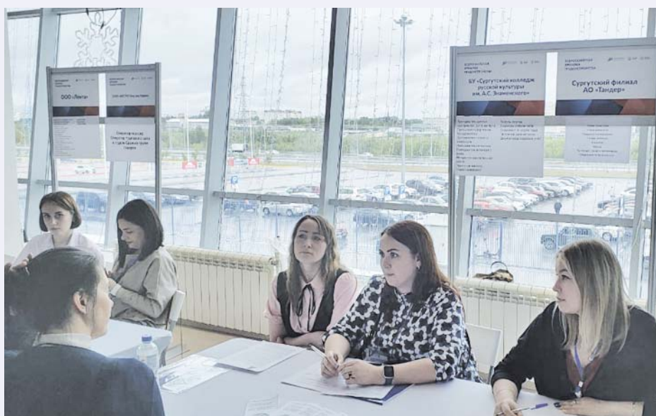
Пройти собеседование можно было сразу у нескольких работодателей

– На ярмарке посетители могут найти не только вакансии, но и возможности для профессиональной переподготовки: не все знают, например, что в нашем университете есть программы дополнительного образования по разным направлениям. Кроме того, тот, кто ищет работу, может поступить учиться в магистратуру, что в дальнейшем даст дополнительные возможности для его профессионального развития. Также наш университет выступает и как работодатель: у нас есть вакансии бухгалтера и преподавателей.