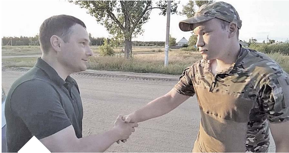
Югра всегда поддерживает своих сыновей, которые находятся в Донбассе, Запорожской и Херсонской областях.

– Вы должны понимать, что главная задача сегодня – отстаивать интересы Родины, потому что если мы не остановим врага здесь, в зоне СВО, завтра