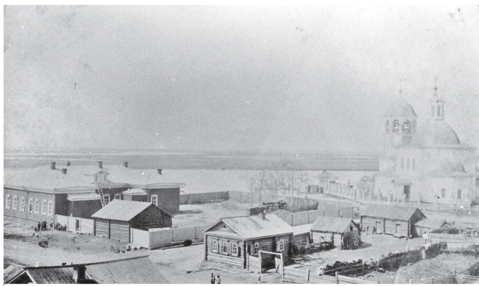
Редкий снимок Сургута начала XIX века

В преддверии 430-летия Сургута будет проложен исторический маршрут, который свяжет прошлое и настоящее города