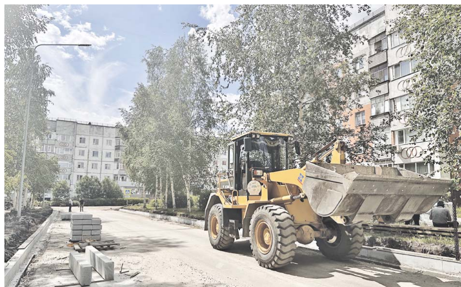
После ремонта улица Бажова заметно преобразится

– Все магистральные направления: дороги, благоустройство, подсветка, содействие бизнесу. И конечно, это наши локомотивы – такие проекты, как НТЦ, сейчас в высокой степени динамики идёт его реализация. Уже в следующем году город начнёт прирастать практически новым микрорайоном – с новым функционалом, новой архитектурой. Это и будущее нашего города, и за это поборемся максимально. Я очень надеюсь, что и здесь всё у нас получится.