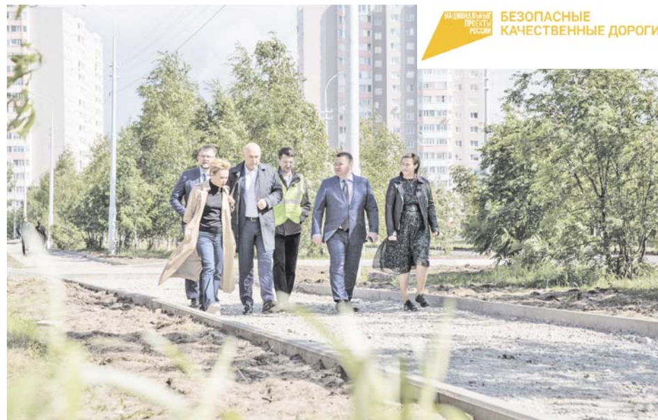
Ремонт дорог – на контроле главы, депутатов, общественников

– Есть дороги, где мы так и делаем. Не везде мы выходим на генеральный ремонт – всё зависит от потребностей или износа тех или иных элементов благоустройства города и дорог в том числе. Есть дороги, которые требуется ремонтировать капитально, потому что и тротуар в ненадлежащем состоянии, и с освещением проблема, где-то даже и ливнёвок нет. Так случилось, что при строительстве не везде были учтены канализации для ливневых стоков. Поэтому нам приходится и на это тоже обращать внимание. И если уж заходить на дорогу, где необходим капитальный ремонт, то делать всё по-взрослому, основательно. Это очень капиталоемкая работа, поэтому определяем некие локации для опережения, 2-4 локации в год, чтобы и по деньгам