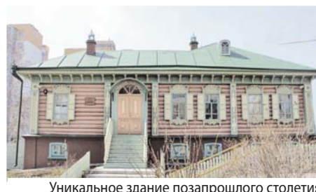
Уникальное здание позапрошлого столетия

Исправник сообщал министру: «Прибыв в Сургут для встречи заранее, я был поражён усердием, с которым этот бедный и забытый городок старался, не жалея значительных затрат, украсить пристань; но тут же узнал, что, кроме подношения хлеба-соли от местного мещанского общества, готовится поднести блюдо и икону отдельная группа мещан, именующих себя доньине казаками и не желающих признавать распоряжение правительства, которым они ещё в 1885 году зачислены в мещане». Казаки подали Его Сиятельству прошение о возвращении их в казачье звание, но услышаны не были. Вакарин призвал к себе троих бывших казаков и «старался им внушить, что они должны примкнуть к мещанскому обществу для поднесения хлеба-соли, на что получил дерзкий ответ, что они не желают идти с мещанами, и если лапотникам позволяют подносить, то им, потомкам Ермака, никто не смеет запретить». И устроили бучу по прибытии наследника в Сургут, попытались силой вломиться на пароход, но попытку вовремя пресекли, а самых буйных заключили на 4 месяца в Туринском тюремном замке Гаринской волости. Среди смутьянов был и брат старосты Сургута Галактиона Степановича Клепикова . Того самого Клепикова, усадьба которого сохранилась до наших дней.