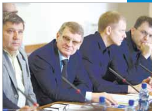
Откровенно о главном