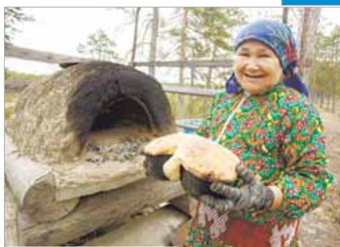
В гостях у ханты