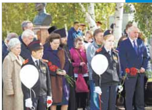
Вместе против террора