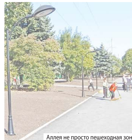
Аллея не просто пешеходная зона

Кстати, на пришкольной территории югорчане ещё и отличный уголок здоровья построили. Такие оригинальные тренажёры для «качков» раньше можно было увидеть только в дорожных спортклубах. Оказывается, в России они для всех доступны. Причём бесплатно – тренируйтесь, не ленитесь!