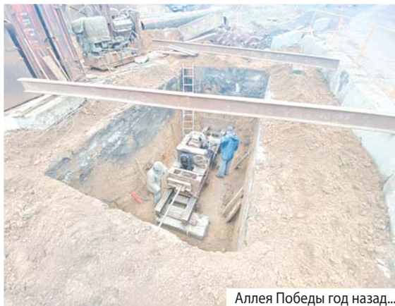
Аллея Победы год назад...

Темой особых разговоров в микрорайоне «Зелёный» стал посев травы на газонах аллеи с помощью гидравлики. Каких только пугающих версий ни выдвигали жители округи, чтоб объяснить, почему будущие газоны моментально обретают зелёную окраску.