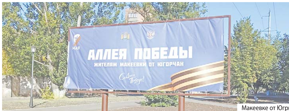
Макеевке от Югры

Очень важно, что обновлённая аллея связала два детских сада – «Богатырь» и «Калинку», а также крупнейшую в городе СШ № 50. Лучшего способа воспитания у детворы чувства любви к родному городу, к природе, к прекрасному просто не существует.