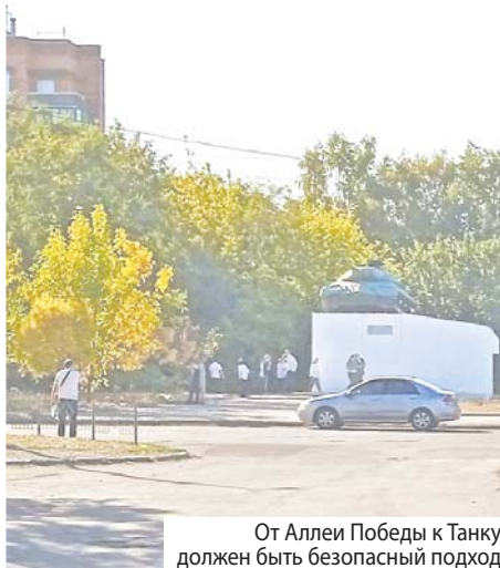
От Аллеи Победы к Танку должен быть безопасный подход

Вкратце смысл технологии следующий: движок одновременно рассеивает смесь семян газонной травы, мульчирующего материала, гидрогеля, закрепителя, улучшителей почвы и удобрений.