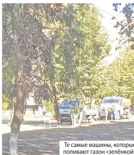
Те самые машины, которые поливают газон «зелёнкой»

– С точки зрения мировой практики гидропосев является прогрессивным и надёжным методом формирования газона. Этот способ устраняет несколько факторов риска и позволяет эффективно и рационально использовать ресурсы: посевной материал, территорию и затраты на первичный уход. Однако следует соблюдать всю агротехнику процедуры. В первую очередь – подготовка соответствующего места под озеленение. Здесь очень важно не только перекопать урбанозём, но и создать соответствующую плотность грунтового слоя. Ещё нюанс – первые 2-3 недели нужен хороший равномерный полив, даже