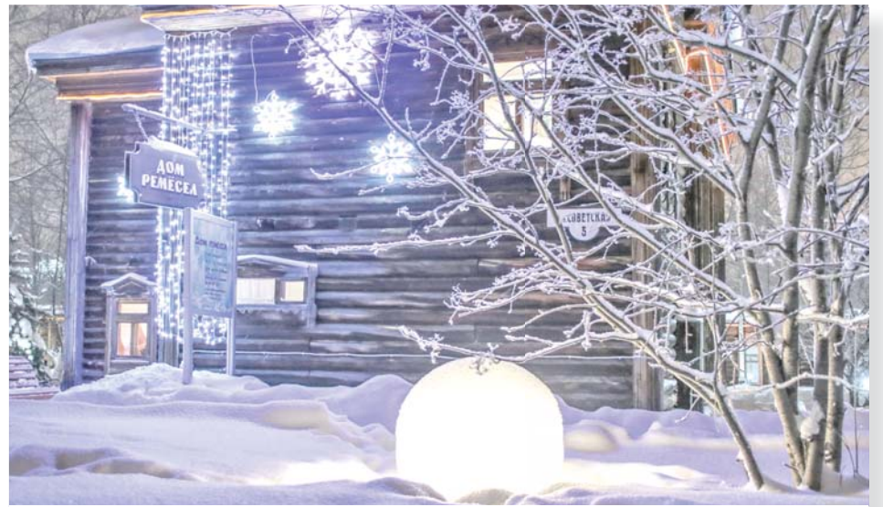
Такой дом могли позволить себе только зажиточные купцы. В Сургуте их было два.

что с 20-х годов прошлого столетия в доме на Советской, 5 размещался Сургутский народный суд и находился там до 1968 года.