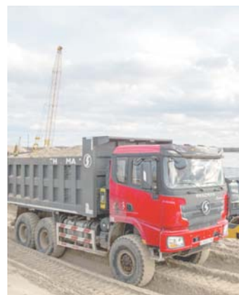
В Сургуте на берегу Оби строят инновационный научно-технологический центр

– Если обратиться к истории города, Сургут был северным форпостом российского государства, поставщиком ценных ресурсов, местом ссылки для заключённых, нефтегазовым Клондайком. Каким