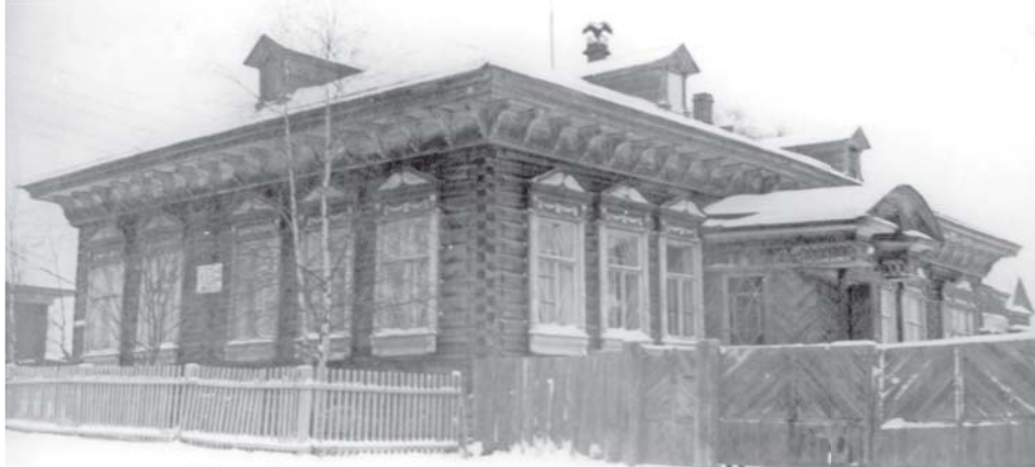
Знаменка – здание белой школы. 1944 г.

ИКЦ «СТАРЫЙ СУРГУТ» – УНИКАЛЬНЫЙ СИМВОЛ ГОРОДА