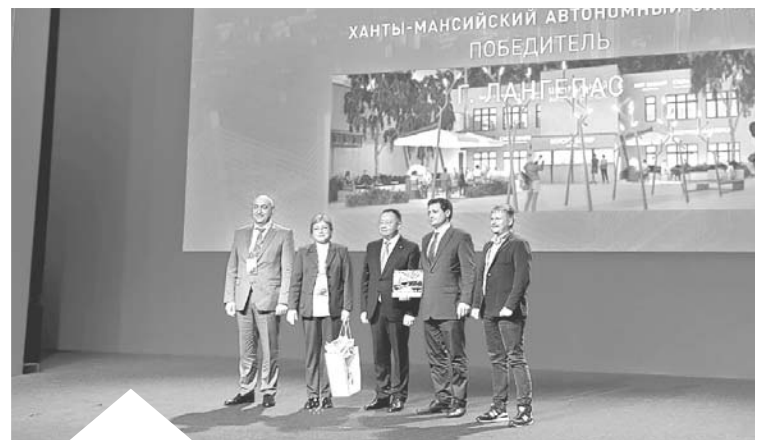
Лангелас победил во всероссийском конкурсе комфортной городской среды