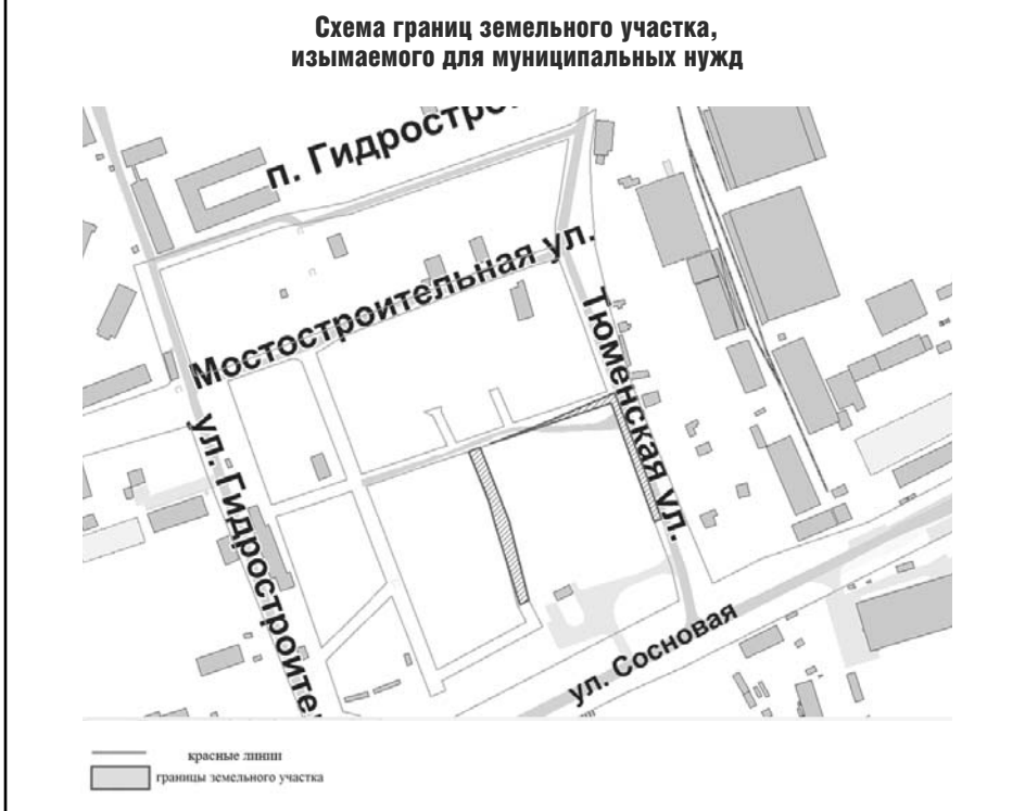
Приложение 2 к постановлению Администрации города от 23.11.2023 № 5816