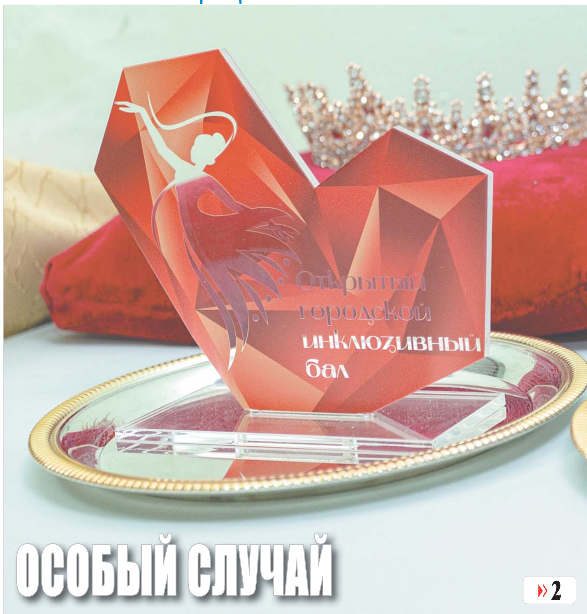
Фото городского культурного центра