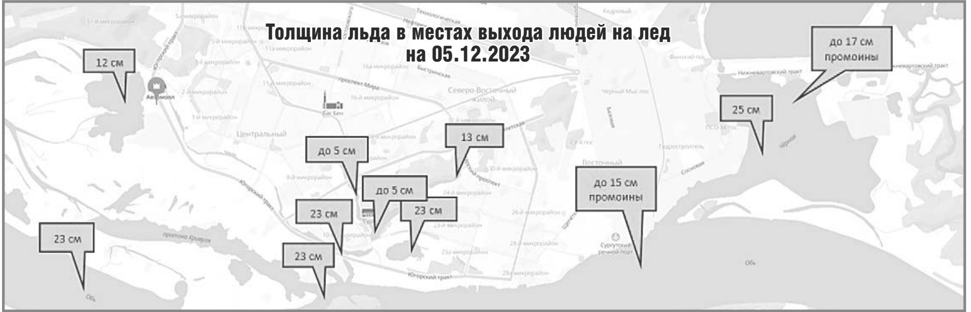
Толщина льда в местах выхода людей на лед на 05.12.2023