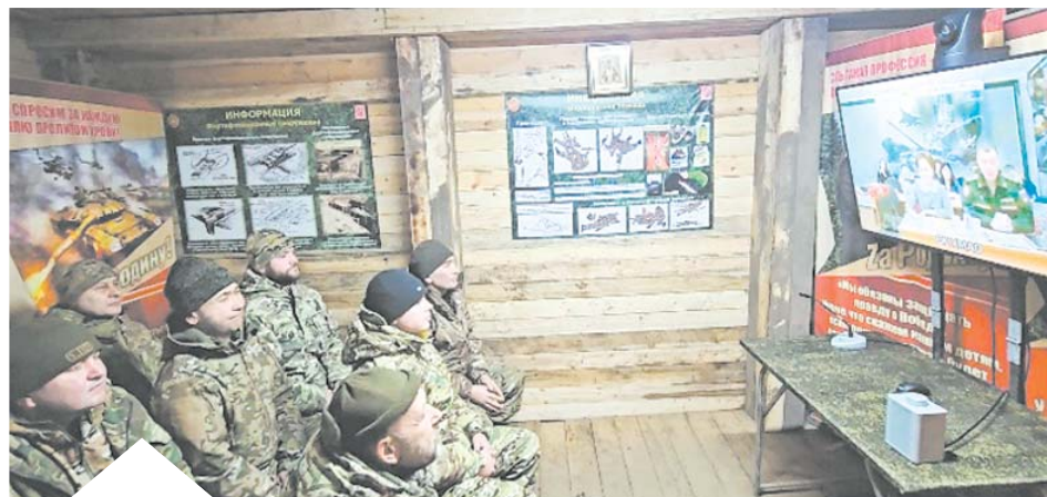
Военком и омбудсмен заверили бойцов, что власти Югры активно помогают их семьям, пока военнослужащие находятся в зоне СВО

высоко оценивают условия, которые организованы Минобороны, а также помощь от региона.