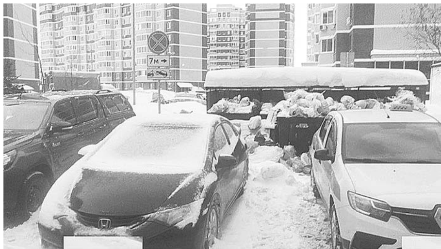
Административная комиссия города Сургута

Так, в текущем году за совершение правонарушений данной категории к ответственности привлечено 2 человека .