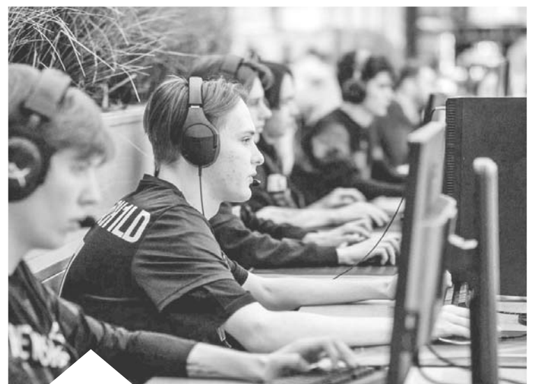
Чемпионат «Цифровая лига Сургута»

Напомним, что региональный конкурс инициативных проектов проходит с 2021 года. За три года его участниками стали все 22 муниципалитета автономного округа с проектами, выдвинутыми жителями по приоритетным для них вопросам местного