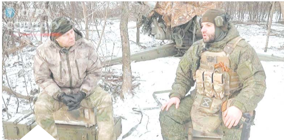
«Русский – значит человек, понимающий историю этой страны, её традиции. Русский – это состояние души», – говорит «Централ»

Чужих в России сейчас нет – всех объединила идея завершить победой эту трудную работу по возвращению в родную гавань исконных русских земель