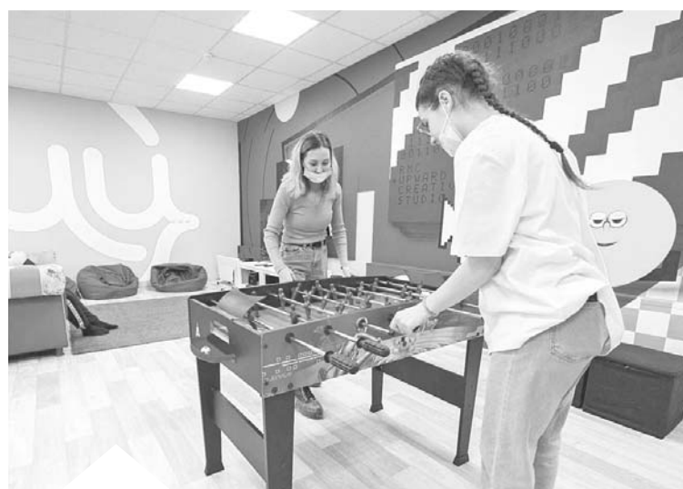
Проект «Молодёжный центр в каждом селе»