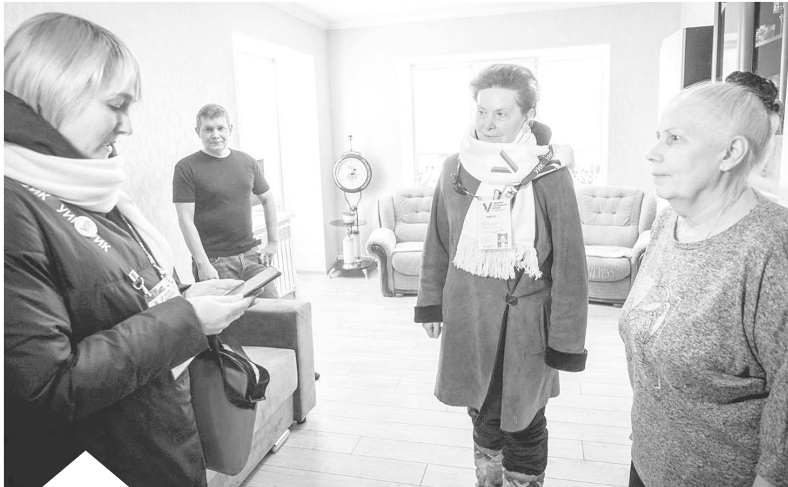
Наталья Комарова назвала участие в выборах президента проявлением сплочения

Губернатор Югры Наталья Комарова лично пригласила югорчан на выборы президента