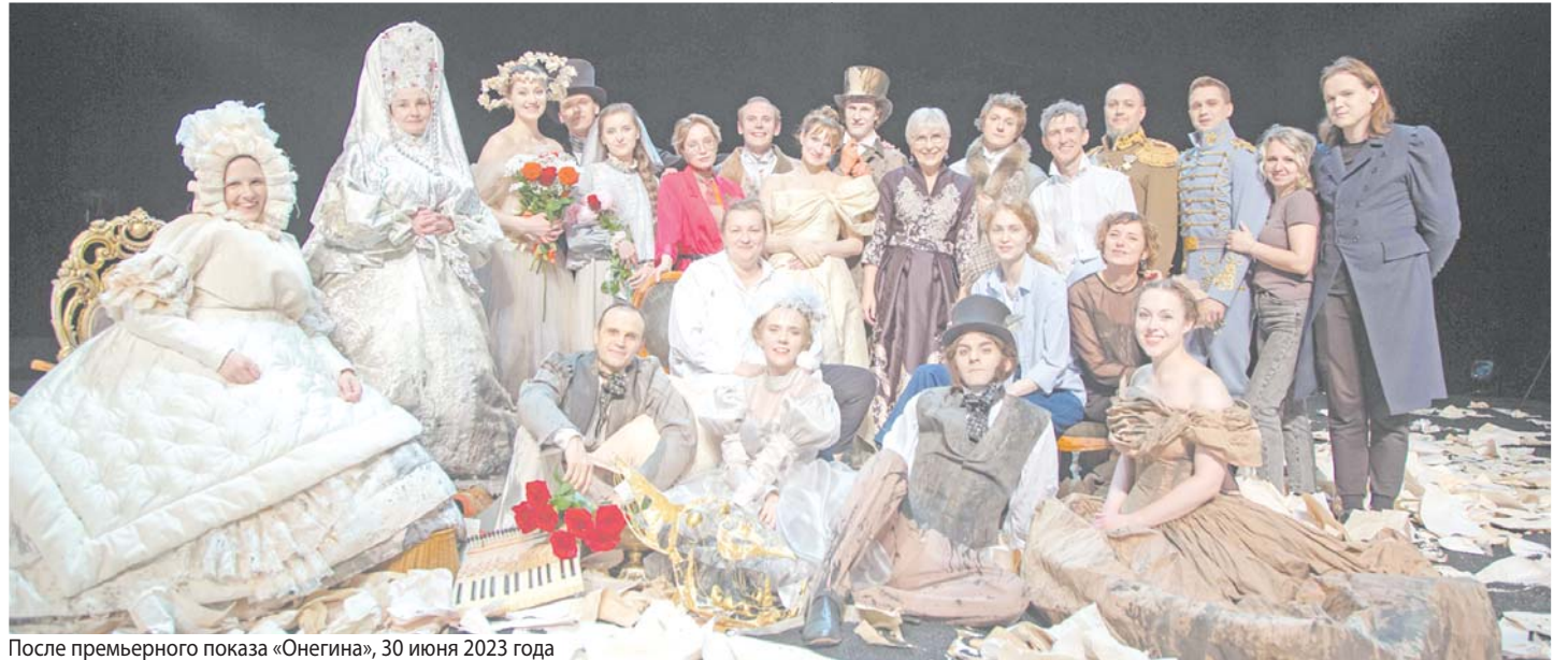
После премьерного показа «Онегина», 30 июня 2023 года

Яре с «Островом сокровищ». На апрель планируем Коголым. То есть до конца сезона перспектива понятна.