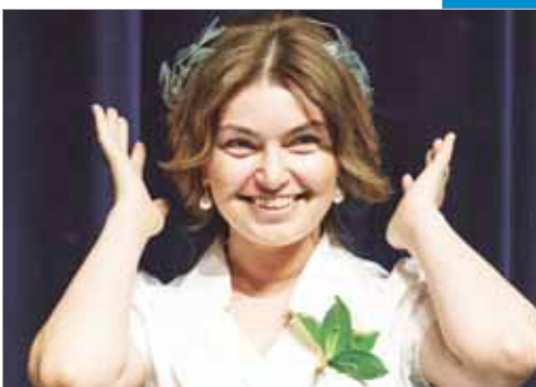
Лучи славы и лавровые венки