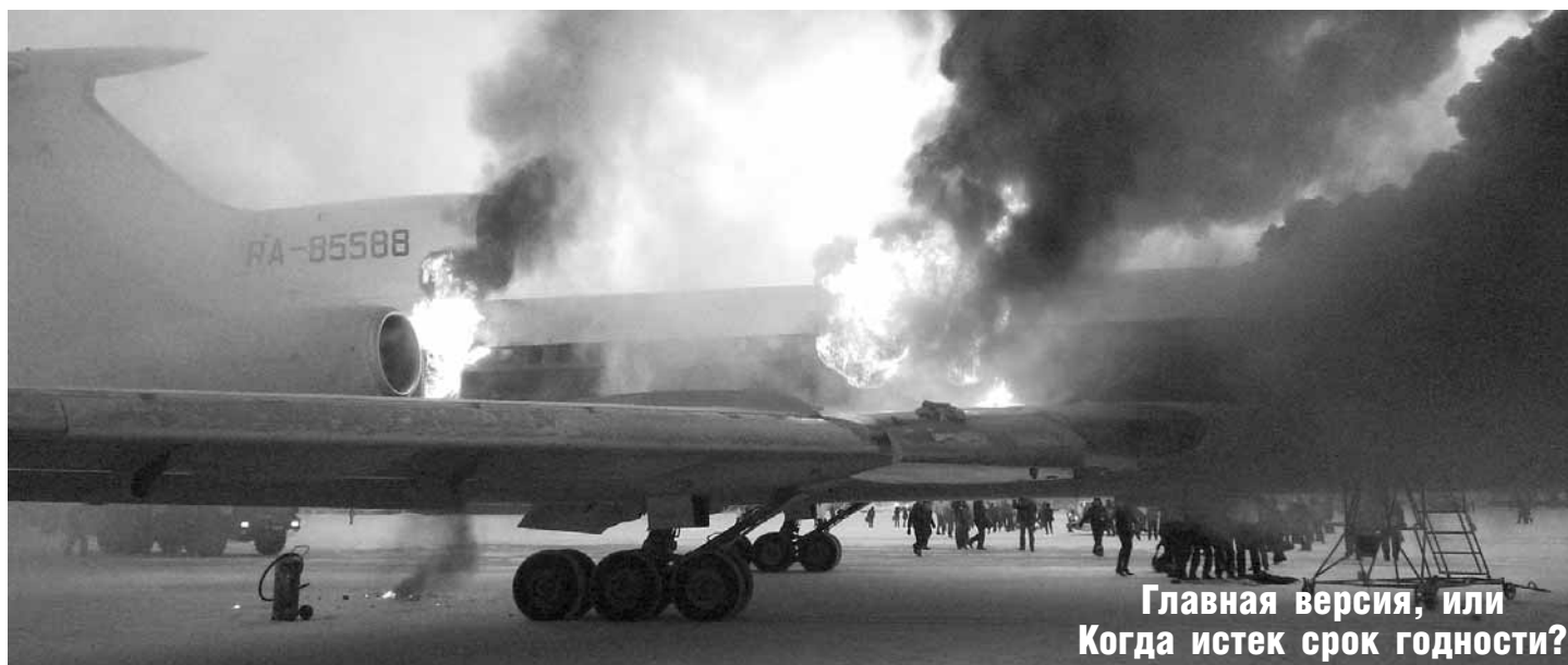
Главная версия, или Когда истек срок годности?

В первый же день нового года о Сургуте заговорила вся страна. Повод для такого внимания нерадостный – авиационное происшествие, в котором пострадали люди. Авиалайнер Ту-154Б-2 RA-85588 компании «Когалым-авиа» еще не пошел на взлет, когда в салоне вспыхнул пожар. Из 134-х человек (включая и членов экипажа) спаслись не все. Трое пассажиров, двое из которых – отец с 7-летней дочерью – до сих пор официально считаются пропавшими без вести. Эвакуироваться пришлось в экстремальном режиме: кто-то спустился по запасным трапам, а кто-то, рискуя здоровьем, выпрыгнул из самолета на асфальт. На месте аварии работают эксперты МАК. Они и должны ответить на главный вопрос: в чем причина случившегося?