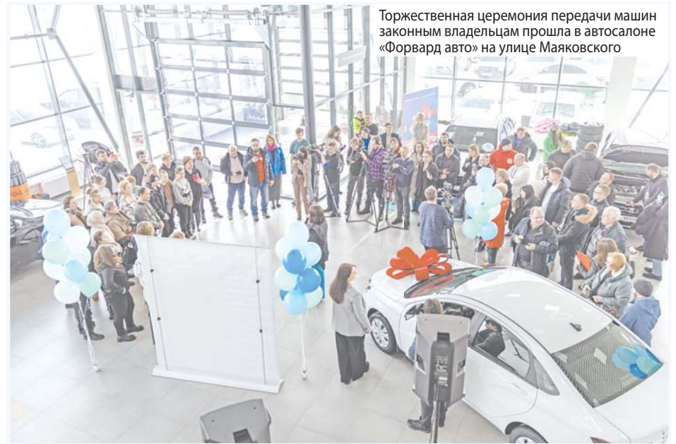
Торжественная церемония передачи машин законным владельцам прошла в автосалоне «Форвард авто» на улице Маяковского

Автомобили «Лада Веста» для победителей Викторины «Достижения Югры» вместо замка зажигания имеют кнопку «СТАРТ/СТОП», механическую коробку передач, оснащены кондиционерами, мультимедийным семидюймовым дисплеем, задними дисковыми тормозами.