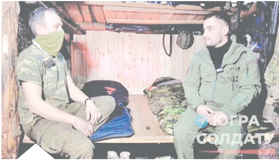
Во время одного из заданий боец увидел «глаза» противника – разведдрон ВСУ был прямо над головой