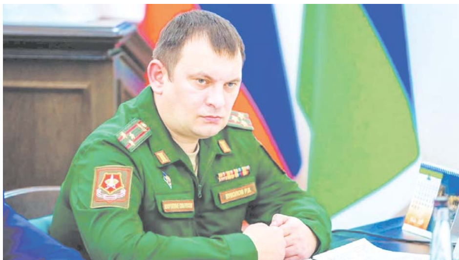
Срок военной службы остается неизменным – один год, и для участия в выполнении задач специальной военной операции военнослужащие, проходящие военную службу по призыву, направляться не будут

– При непосредственном участии Минобороны России разработаны три федеральных закона и два постановления правительства, принципиально поменявшие подходы к учетно-призывной работе. И одно из важных